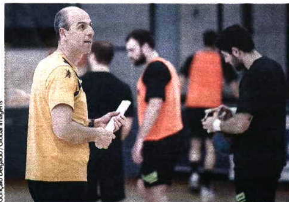
Concílio Delgado / Global Images

hei, a cidade de um adversário que não assusta. “É a minha primeira final europeia como jogador ou treinador, mas tenho quatro que já conquistaram esta taça. Esta malta é fantástica e mal seria se não estivesse toda muito motivada”, concluiu o técnico, que entra em campo com quatro golos de vantagem, fruto da vitória, por 3-2, no Flávio Sá Leite. O jogo de domingo será às 15h00 portuguesas e em Braga haverá um ecrã gigante, no pavilhão, para quem quiser ver.