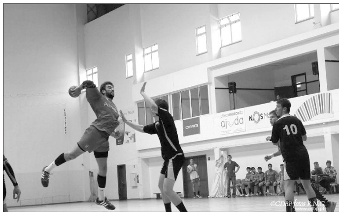
Bartolomeu Perestrelo defrontou Águas Santas no arranque da fase final juvenis.

No próximo sábado, realizam-se os últimos módulos do XXV Clinic AAM, onde serão abordados as "Lesões mais frequentes na modalidade de ande-