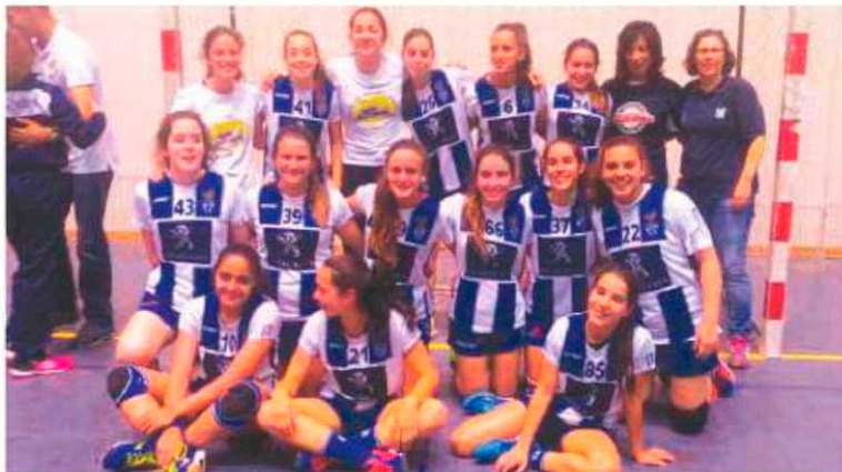
Madeirenses vão discutir o apuramento para a fase final nacional.

No sábado será a vez das insulares defrontarem a equipa da casa, o Lagoa, pelas 18 horas, para no dia seguinte fecharem a competição frente ao Valongo (10 horas). P. V. L.