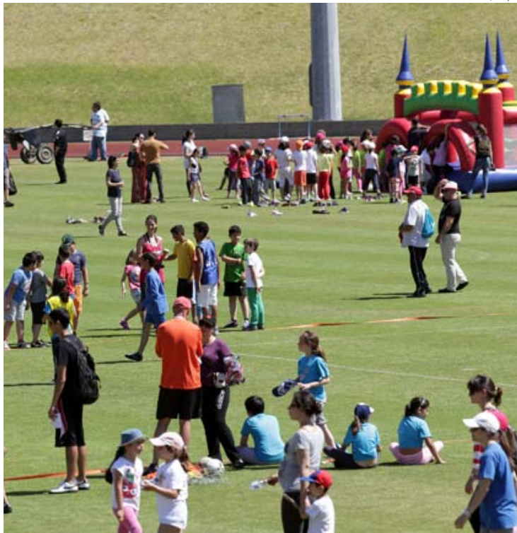
ENCONTRO ANUAL DE ESCOLINHAS com programa bastante diversificado

O Serviço de Desporto da Terceira vai dinamizar no próximo dia 23 de maio, sábado, no período compreendido entre as 10:00 e as 12:00, no excelente Complexo Desportivo João Paulo II, em Angra do Heroísmo, o designado XIV Encontro das Escolinhas do Desporto.