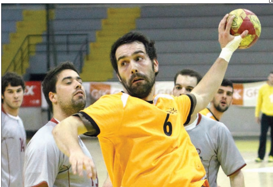
UM venceu Málaga na modalidade de andebol

No andebol, após um início menos bom as coisas estão a encaminhar-se da melhor forma para os minhotos. Neste ter-