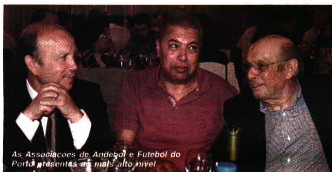
As Associações de Andebol e Futebol do Porto presentes ao mais alto nível