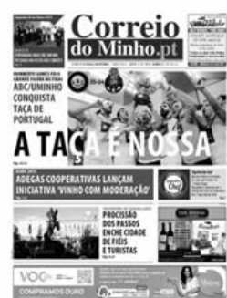
ABC/UMinho conquistou a Taça de Portugal de andebol e marcou presença na final da Taça Challenge, na Roménia

ABC festejou o título de campeão nacional de juvenis, com uma brilhante vitória por 31-21, frente ao Águas Santas.