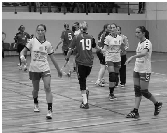
JUVE LIS aposta na vitória nos dois jogos contra as jogadoras letãs

Refira-se que os dirigentes, técnico e atletas têm-se esforçado para arranjar dinheiro para colmatar as despesas que uma prova desta envergadura provoca. A 'família da Juve' tem vendido rifas, assim como tem organizado outras iniciativas para angariar alguns fundos porque as despesas da equipa visitante são todas por conta do clube leiriense, tal como todos os elementos de organização do jogo, onde está incluído o pagamento aos árbitros. I