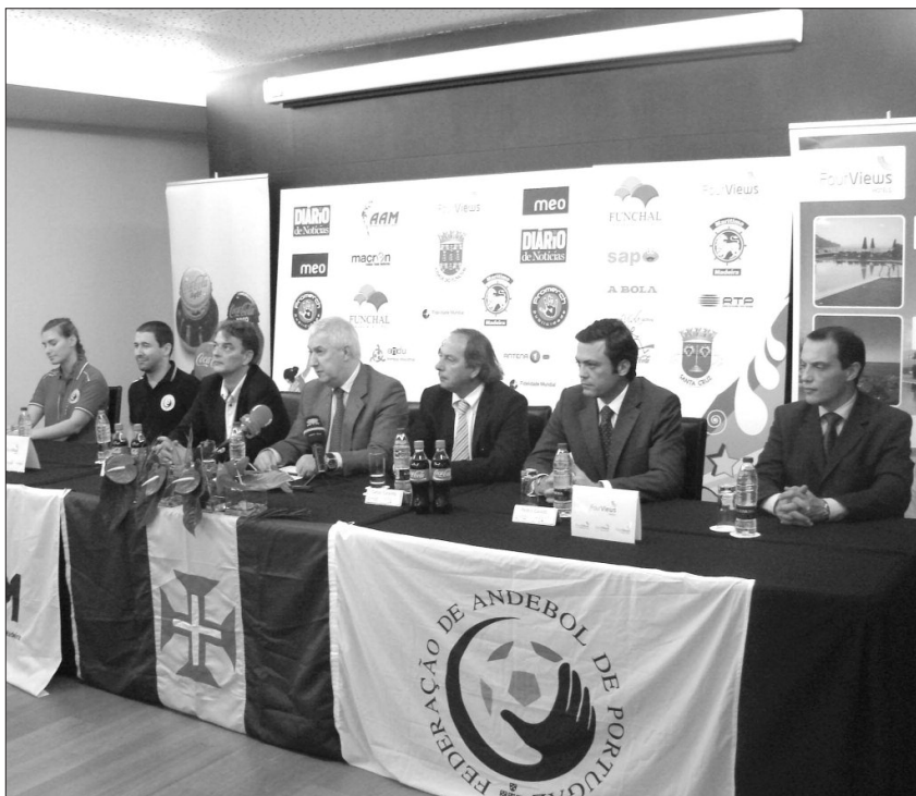
● "Nós 2013/2020" será um novo ciclo para a modalidade no nosso País, onde todos vão intervir nos modelos competitivos.

JORNAL da MADEIRA: Como é que analisa o momento actual do Andebol em Portugal?