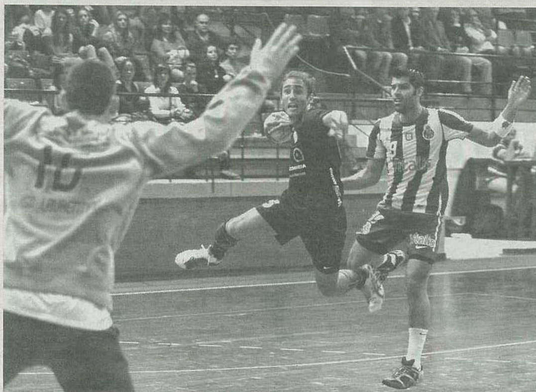
Desde 2007 que o Madeira SAD não vence qualquer jogo arbitrado por António Trínca e Tiago Monteiro.