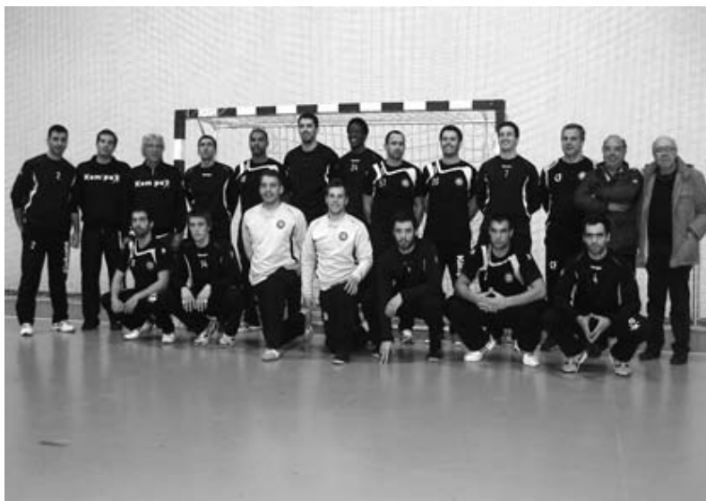
Equipa do ABC está na Sérvia para defrontar uma dupla jornada com o Radnicki a contar para a Taça Challenge