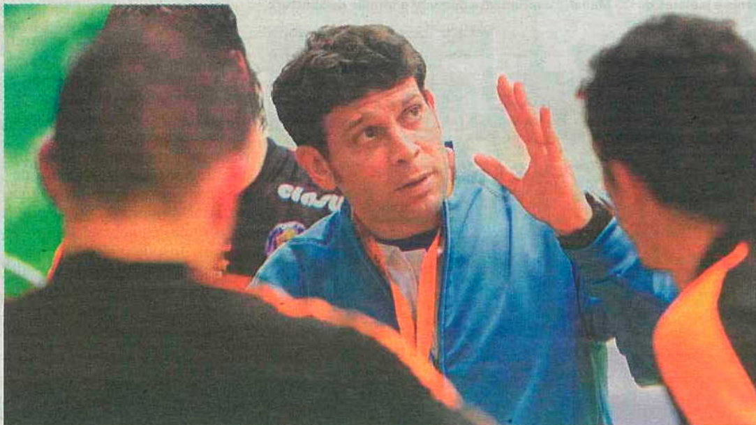
O Madeira SAD perdeu mas provou ser um caso sério no andebol masculino nacional.

HERBERTO DUARTE PEREIRA desporto@dnoticias.pt