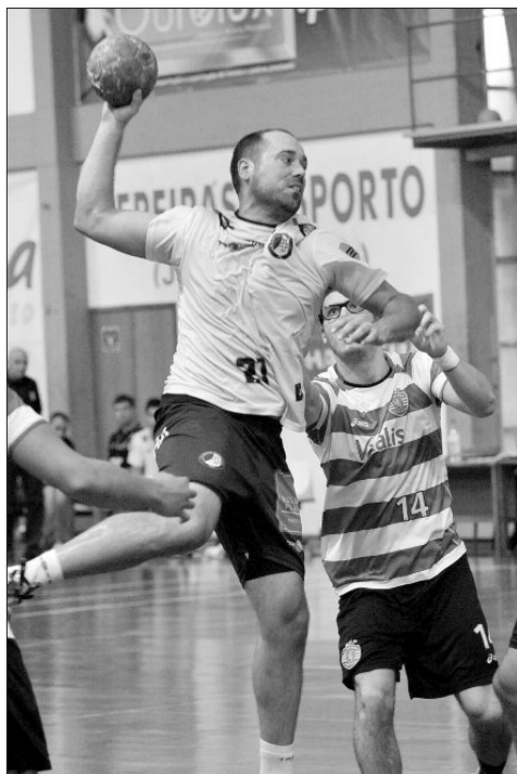
Madeira SAD recebe domingo o Camões

Arrancou já a disputa da 6.ª jornada da liga portuguesa de andebol masculino, com o Benfica a vencer o dérbi de Lisboa, ganhando ao Sporting, por 28-22, em Alvalade.