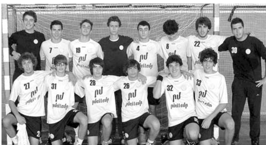
Juvenis masculinos do Pateira – Realizaram mais um jogo amigável, desta vez em Avanca, perdendo por 34-35.

CD Pateira – Os juniores masculinos começam o nacional como Feirense (fora) no domingo às 19 horas. Na véspera, estreiam-se os juvenis masculinos e femininos, ambos em casa, com o CAI Conceição (17h) e Ac. Espinho B (hora não indicada) respectivamente. Já os iniciados masculinos têm jogo de estreia marcado para domingo, em São Bernardo (hora ainda não indicada).