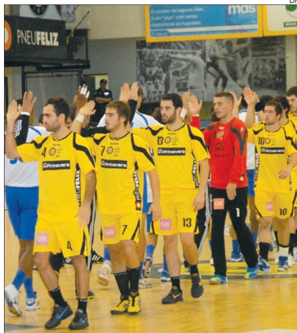
ABC/UMinho jogam esta tarde (17h00) com Águas Santas

Eis os jogos de hoje: Águas Santas-ABC/UMinho, Avanca-FC Porto, Belenenses-AC Fafe e Sp. Horta-Xico Andebol.