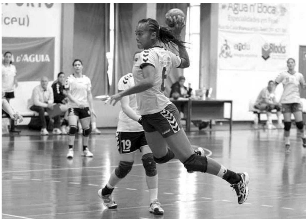
Madeira SAD já conquistou a Supertaça esta época.