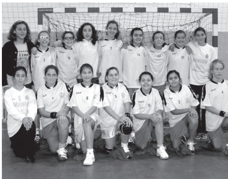
Infantis femininos da Casa do Povo de Valongo do Vouga

Uma boa organização defensiva e a boa capacidade de finalização da meia distância são os dois factores que têm marcado a diferença da CPVV em relação aos seus adversários nos três escalões.