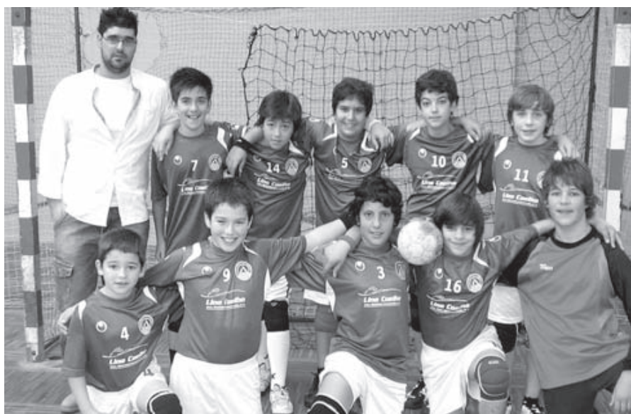
A equipa de infantis do Águeda Andebol Clube