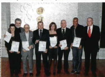
Histórico Campeões olímpicos juntos