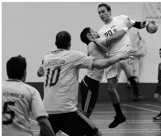
PROJECTO visa incentivar a prática do andebol nos mais jovens

Incentivar os docentes de Educação Física para o fomen-