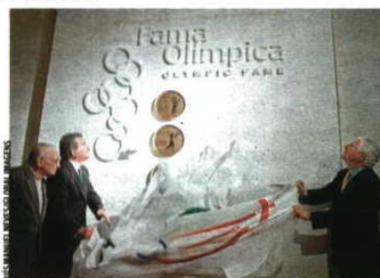
Painel Trajecto olímpico para a posteridade

Carlos Lopes, Rosa Mota, Fernanda Ribeiro e Nelson Évora foram homenageados