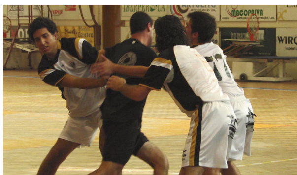
ACADÉMICO e Académica na luta pelo primeiro lugar (arquivo)

Ílhavo AC-Juv. Desp. Lis; Ac. Viseu-Samora Correia; Batalha AC-20KM Almeirim e Albicastrense-SIR 1.º Maio