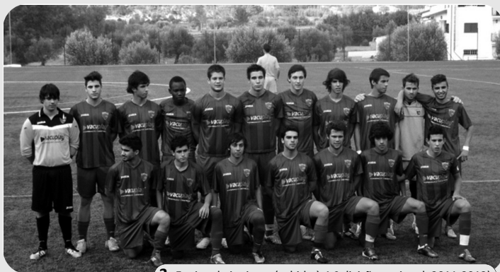
3. Equipa de juniores (subida à 1.ª divisão nacional, 2011-2012)