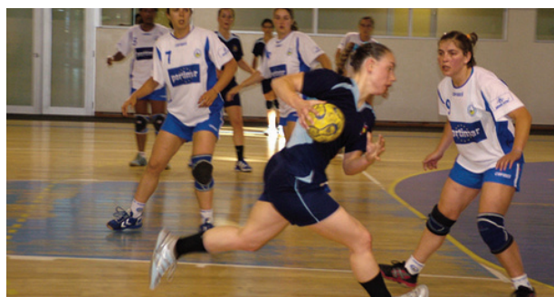
ANDEBOL feminino anima Oliveira de Frades no fim-de-semana

A partir de hoje e até domingo, o pavilhão gimnodesportivo será palco de muitos jogos, em andebol feminino, com equipas de norte a sul do país