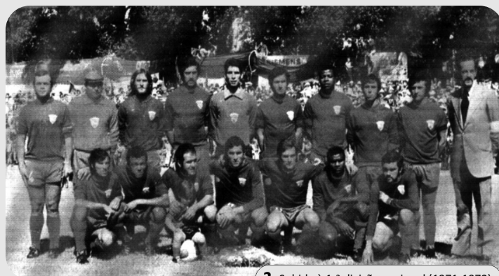
2. Subida à 1.ª divisão nacional (1971-1972)