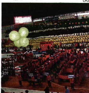
Em 2010, em Maputo, foi assim a abertura

Os serviços consulares de Portugal na Guiné-Bissau receberam, na última sexta-feira, 79 pedidos de visto para atletas participantes nos oitavos Jogos da CPLP, que decorrem em Mafra, entre 7 e 15 de julho. O problema é que o governo de transição já tinha negado a participação do país. «Se não nos reconhecem não nos querem na sua casa», atirou o o porta-voz do governo de transição da Guiné Bissau, Fernando Vaz, alegando que o país não participa porque há outras prioridades financeiras, mas também porque a organização não reconhece o governo de transição.