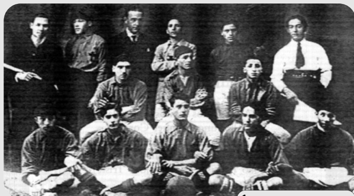
1. Primórdios do clube (1920)