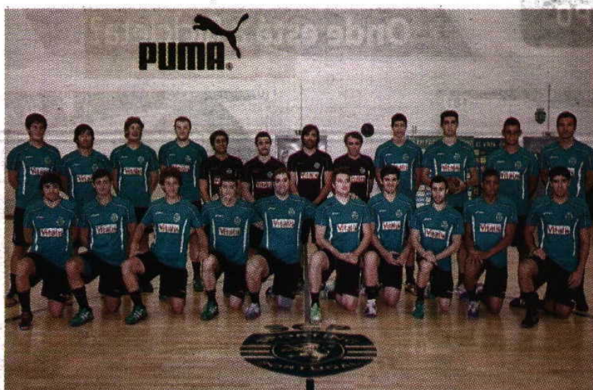
Com novidades > Sporting tem dois reforços e uma nova equipa técnica