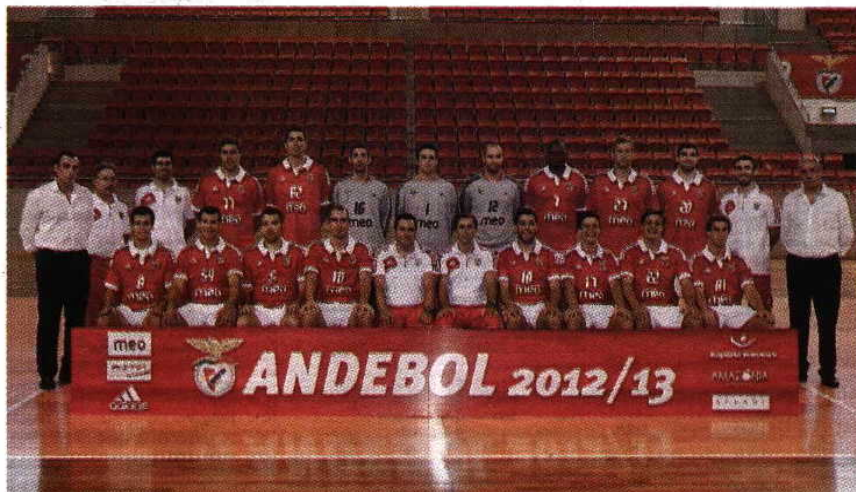
Muito forte > Benfica apresentou mais cinco reforços, dois deles vindos de Espanha

Espanha Tanto Benfica como Sporting foram buscar reforços ao país vizinho