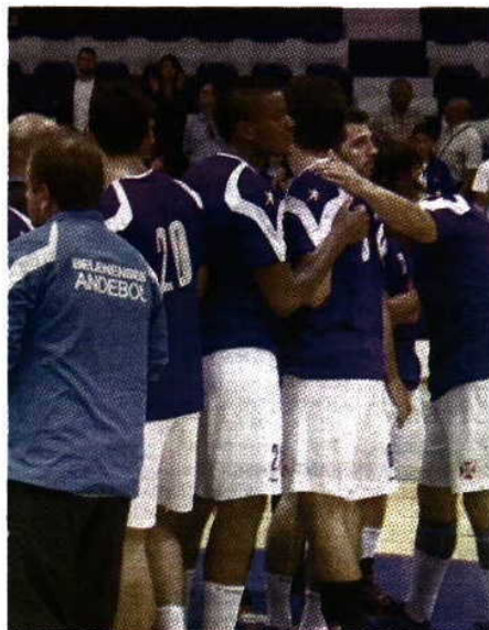
Belenenses subiu na tabela