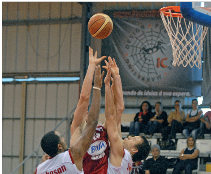
Clube Amigos do Basquete vai adquirir os 50% que pertencem ao GR

O EXECUTIVO MADEIRENSE VAI ALIENAR A TOTALIDADE DO CAPITAL SOCIAL, DEIXANDO DE TER 50% (25.000 AÇÕES) NO MADEIRA MARÍTIMO ANDEBOL, 50% (30.000 AÇÕES) NO CAB E 30% (15.000 AÇÕES) NO MADEIRA ANDEBOL. O PREÇO SERÁ DEFINIDO POR RESOLUÇÃO DO CONSELHO DE GOVERNO E TERÁ POR BASE A AVALIAÇÃO FEITA AOS CLUBES "POR ENTIDADE INDEPENDENTE".