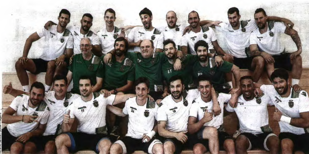
O plantel do Sporting apresentou-se ontem, já com seis caras novas mas prevendo ainda mais um reforço

ANDEBOL Sporting aposta forte no plantel para a próxima temporada, acrescentando experiência e qualidade a uma equipa já de si recheada de valor e de novo orientada por Zupo Equisoain