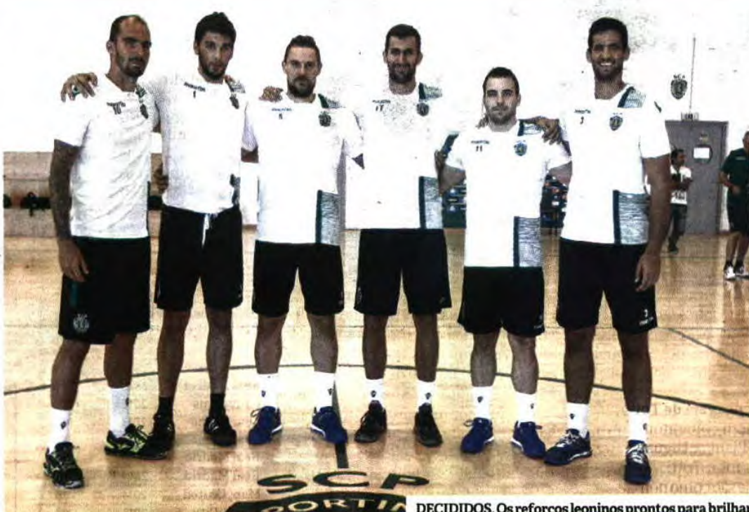
DECIDIDOS. Os reforços leoninos prontos para brilhar