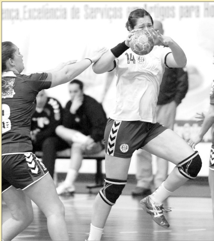
Madeira SAD venceu o Gil Eanes e conquistou a sua 13.ª Supertaça de Portugal.