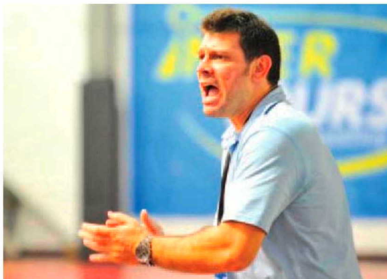
O Madeira SAD somou os primeiros três pontos nos Açores.

Na próxima quarta-feira, à partir das 18 horas, no Pavilhão do Funchal, os madeirenses recebem a formação do Belenenses, naquele encontro que marca a estreia da formação do Madeira Andebol SAD junto ao seus adeptos. H. D. P.