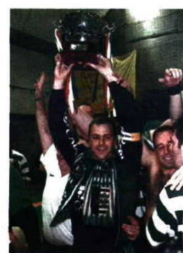
Alvalade fez a festa em 2000/01