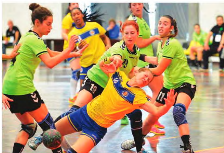
Madeira Andebol foi um justo vencedor.

Hoje, relembre-se o Pavilhão do Funchal volta a ser palco de duas partidas. Logo pelas 12 horas o CS Madeira recebe o João Barros. A partir das 16 horas o Madeira SAD defronta o Juventude de Lis.