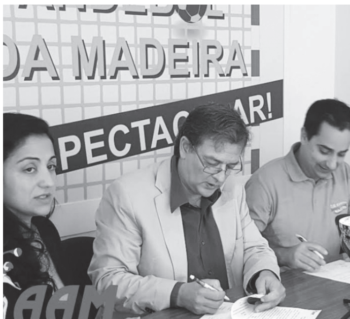
A apresentação decorreu nas instalações da AAM.

Para oficializar esta parceria, os representantes de ambas as instituições assinaram um protocolo de dois anos que garante o apoio da AAM através da isenção do clube das taxas de inscrição dos seus atletas mais jo-