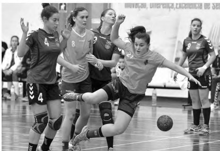
Sports Madeira não foi feliz ontem à tarde.

Ao nível da competição regional disputou-se ontem a final do torneio de abertura de seniores masculinos, com o Madeira Andebol SAD a bater o Marítimo por 35-29 vencendo esta competição que teve a particularidade deste jogo ter sido encontro de cariz solidário onde os ganhos reverteram para a instituição acreditar.