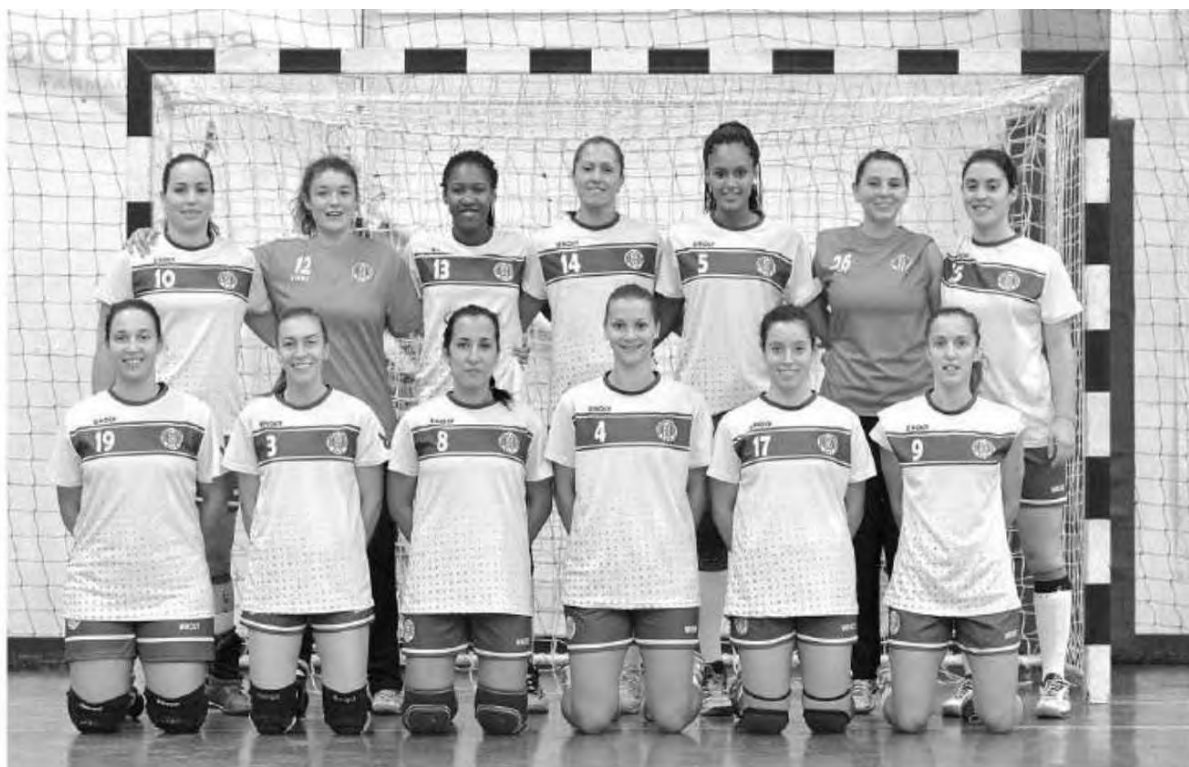
Madeira Andebol SAD defende hoje a liderança frente ao Colégio João Barros, no Funchal.