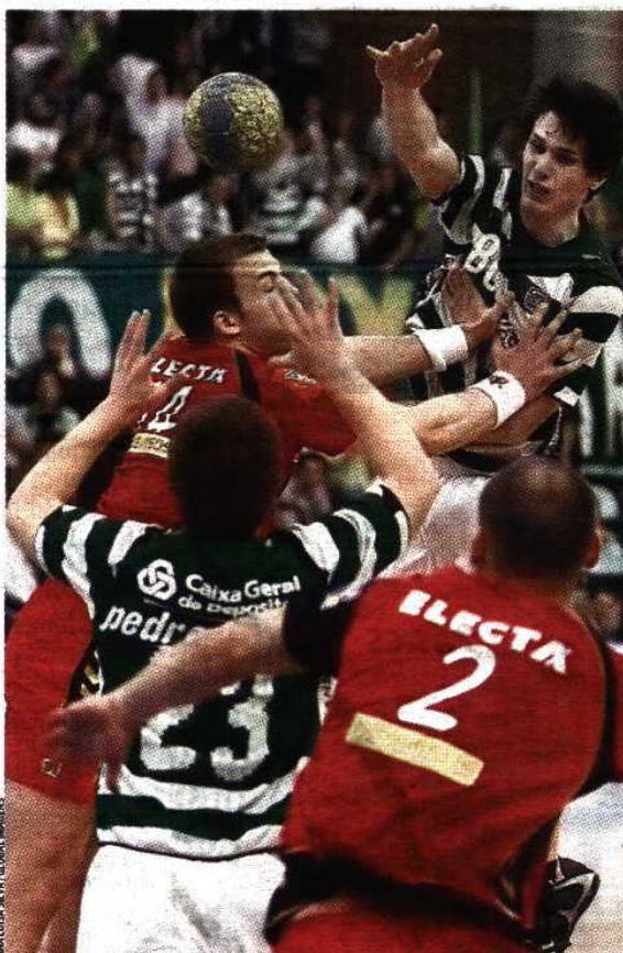
Europa > O Sporting bateu o RD Slovan nas meias-finais