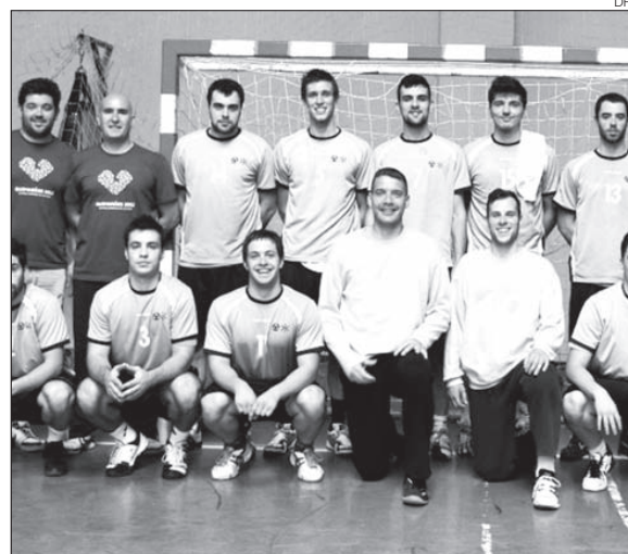
Andebol quer terminar EUSA Games no pódio