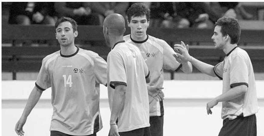
Equipa de futsal da Universidade do Minho soma e segue nos EUSA Games Córdoba'2012