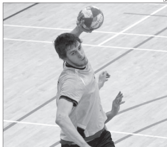
Andebol quer terminar EUSA Games no pódio