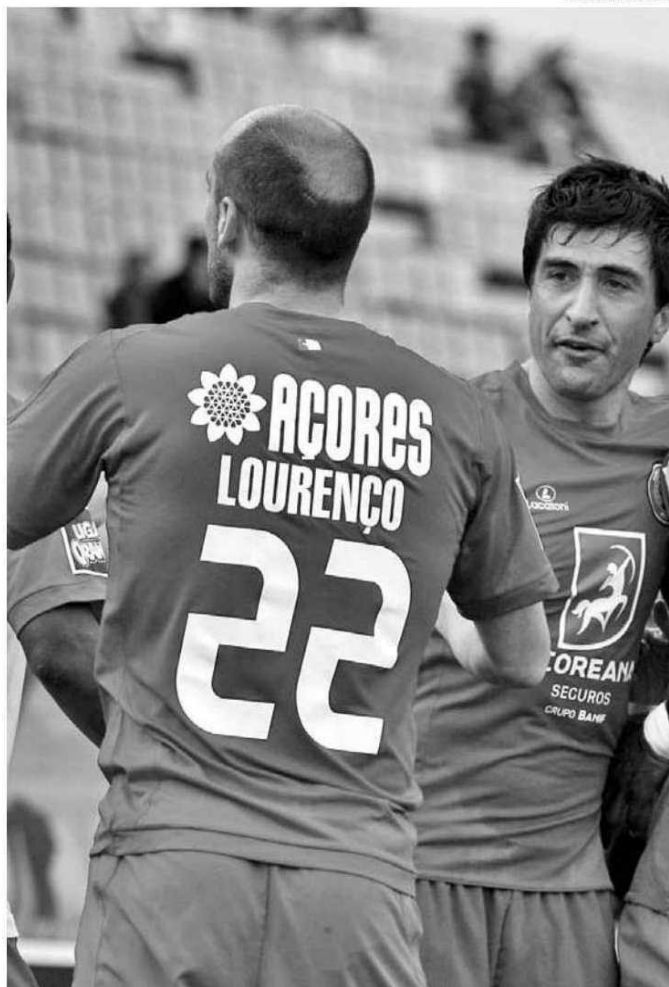
Santa Clara vai receber mais 67 mil euros à custa da revisão dos cortes

São 11 os clubes beneficiados: Santa Clara (futebol), Clube Operário Desportivo (futebol e futsal), Sport Clube Lusitânia (futebol e basquetebol masculino), Clube Juvenil Boa Viagem (basquetebol feminino), Sporting Club Horta (andebol), A. Jovens Fonte do Bastardo (voleibol masculino),