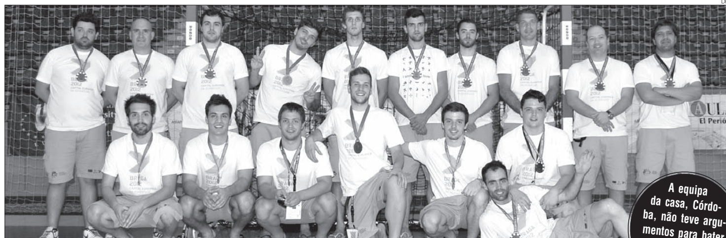
Andebol da Universidade do Minho arrancou a primeira medalha no Eusa Games 2012

A equipa da casa, Córdoba, não teve argumentos para bater a UM, que ficou no pódio