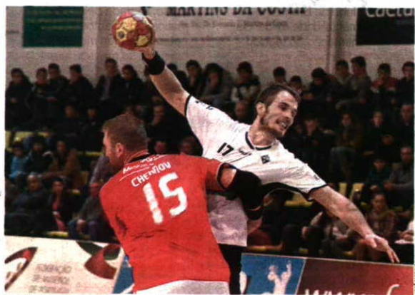
DUELO. Águas Santas e Benfica não se querem atrasar na tabela

DERROTA NA RONDA INICIAL DEIXA BENFICA SEM MARGEM DE ERRO NA MAIA