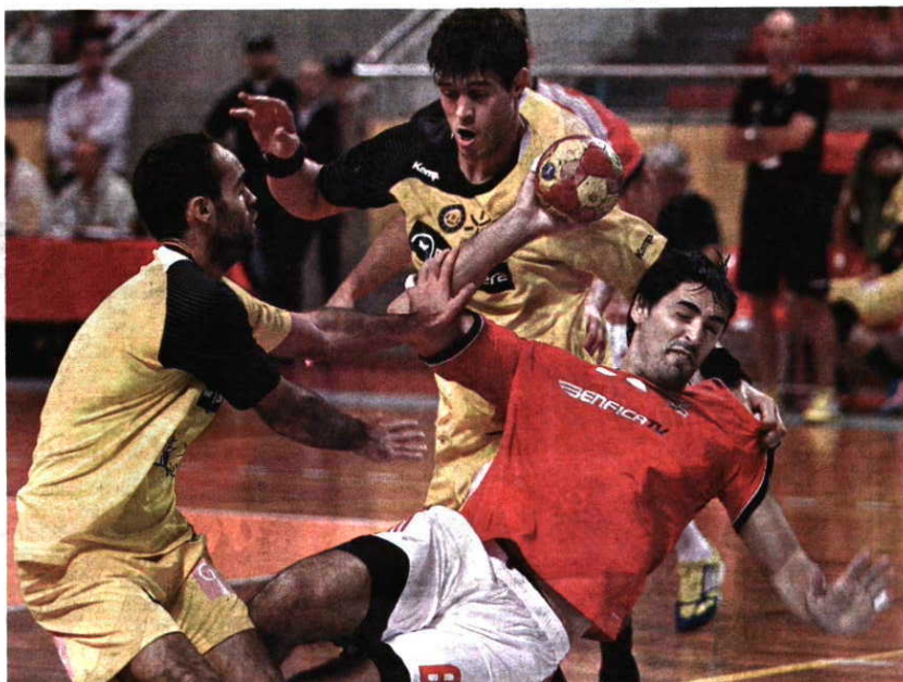
TRADIÇÃO. Benfica e ABC são dois dos emblemas que têm tido um trajeto de glória

Será muito pouco provável, aliás, que dragões, leões ou águias deixem fugir algum troféu para rivais mais modestos, onde também se contam, por exemplo, Águas Santas e Sporting da Horta, atualmente a disputar igualmente o Grupo A da 1.ª Divisão, ou outros históricos como