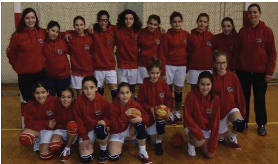
Equipa infantil está a surpreender

Já as iniciadas ganharam também em Castelo Branco às nazarenas do D. Fuas Roupinho, por 26-11. Não obstante este