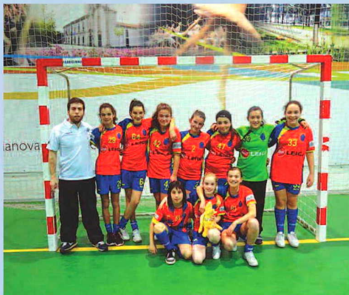
A equipa de infantis femininas

Mais uma equipa do Andebol ACV ascendeu, no fim de semana passado, às competições nacionais. Depois da equipa júnior feminina ACV, foi agora a vez da formação de infantis femininas do clube de Vermoim subir aos nacionais. No domingo, com a vitória sob as congéneres de Fafe por 31-14, no Pavilhão Municipal Terras de Vermoim, as infantis AVC cimentaram o 1º lugar no grupo, carimbando a passagem à fase seguinte da competição a duas jornadas do final desta fase do campeonato regional.