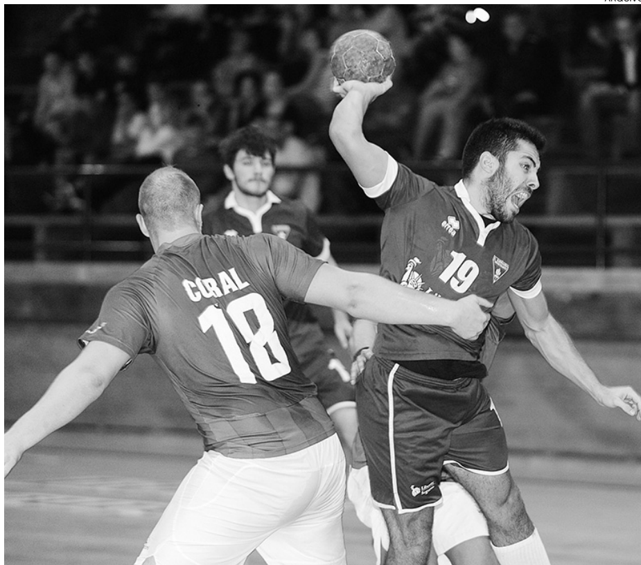
O São Bernardo , ao contrário do jogo do campeonato, venceu o Marítimo para a Taça de Portugal

ricamente, em termos físicos, ter sido negativo para as aspirações do São Bernardo, já que corria o risco de ficar prematuramente afastado da prova, o que não deixaria de ser contrariedade marcante. É que o prestígio que o clube já granjeou na modalidade impõe que não seja afastado logo no início desta competição (as equipas da 1.ª Divisão ainda não entram), muito menos quando joga em casa e perante adver-