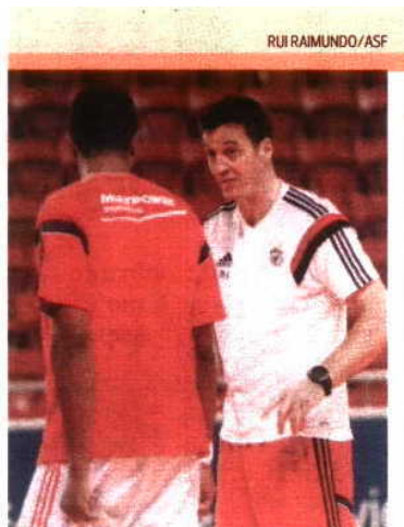
Benfica de Ortega joga com Madeira, SAD