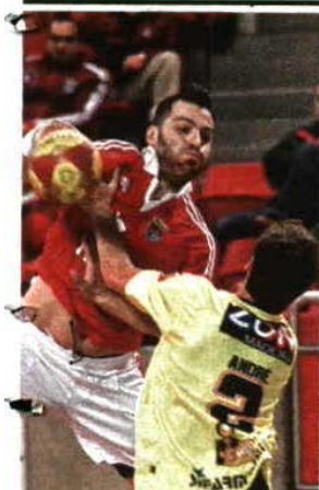
Clássico na Luz promete

ANDEBOL → RECEÇÃO AO MADEIRA SAD NA CONCLUSÃO DA 10.ª JORNADA