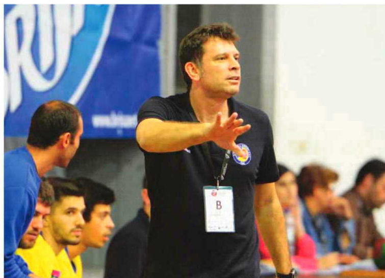
Madeira SAD joga na Luz a partir das 18h30.