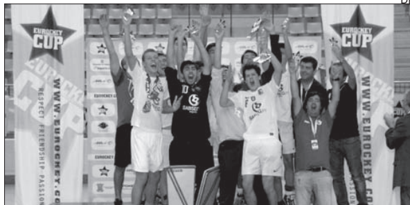
Hóquei de Braga, uma das coletividades apoiadas

Num total de 38 entidades inscritas no Regulamento de Atribuição de Apoios