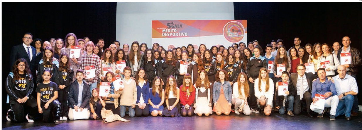
Os galardoados na 5.ª Gala de Mérito Desportivo de Esposende

A Câmara Municipal de Esposende distinguiu 60 atletas, 20 técnicos e 14 equipas durante a 5.ª Gala de Mérito Desportivo, que decorreu domingo, no Auditório Municipal. Foi ainda reconhecido o mérito e a excelência do projeto Desporto Escolar na modalidade de Badminton da Escola Básica António Correia de Oliveira e o projeto de inclusão do Agrupamento de Escolas das Marinhas.