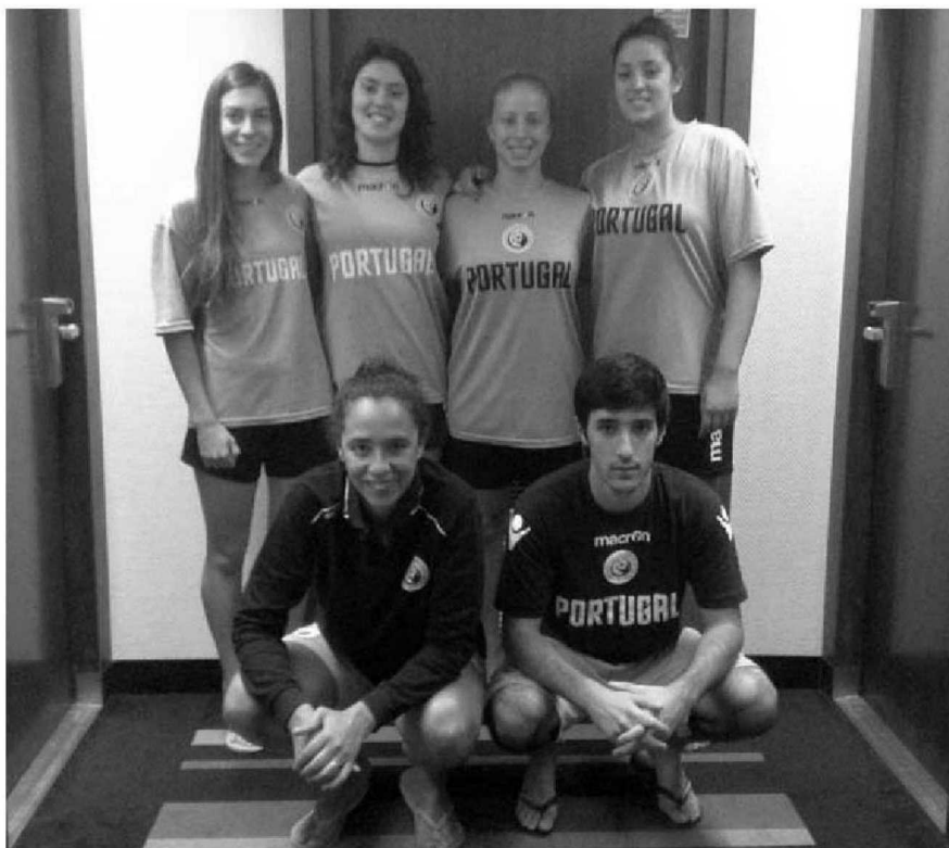
A comitiva madeirense que ajudou no feito alcançado pela selecção lusa em Poznan, Polónia.