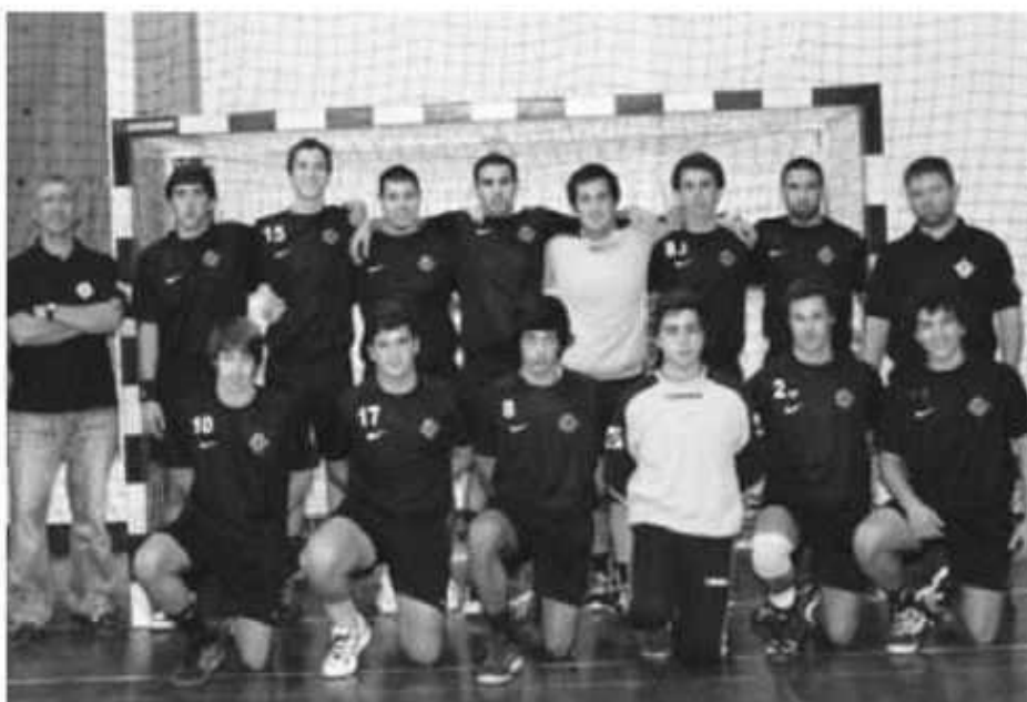
Campeões regionais lutam pela fase final da II Divisão nacional.