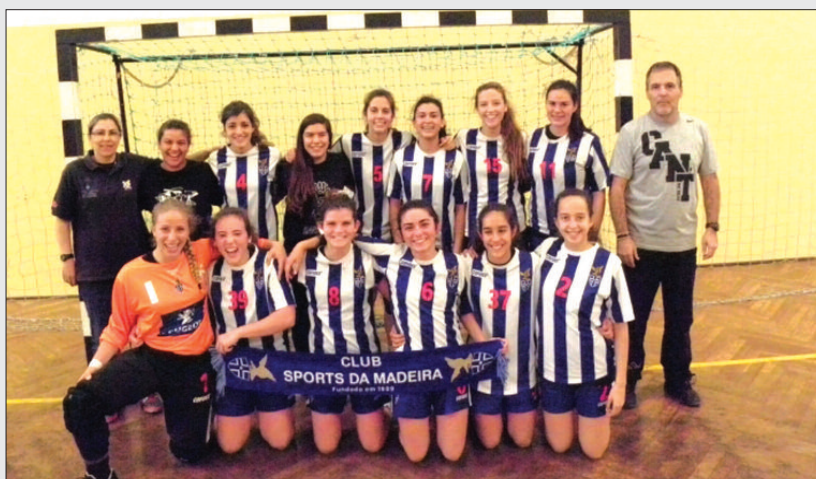
Juvenis femininos do Sports Madeira sagraram-se campeãs nacionais