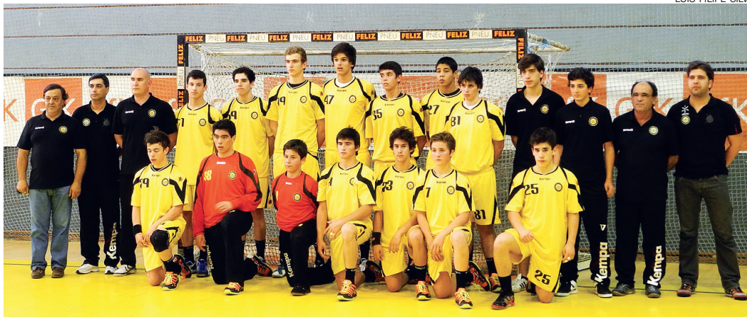
Iniciados do ABC entram a vencer na fase final de iniciados