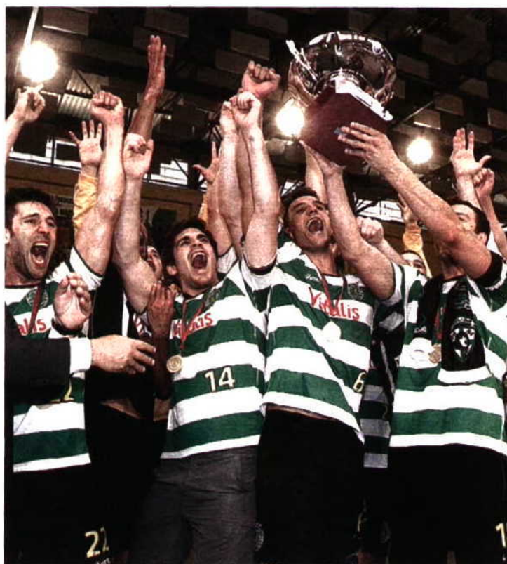
TÍTULO. Andebol fez a festa com a conquista da Taça de Portugal

Atletismo e andebol continuarão a estar na primeira linha e irão merecer um cuidado especial querendo