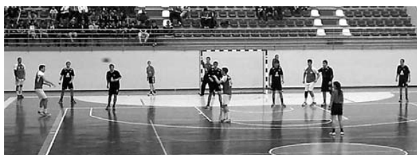
700 atletas envolvidos na iniciativa

G aia recebeu uma reedição do famoso torneio de andebol, realizados nos anos 80 e 90. O HandGaia'14 recebeu 53 equipas, ascendendo a cerca de 700 atletas participantes, com a presença do FC Porto, ABC, Águas Santas, Belenenses, uma Selecção Nacional de Juniores C e um convidado internacional, o Club Balonmán Lalín, da Galiza.