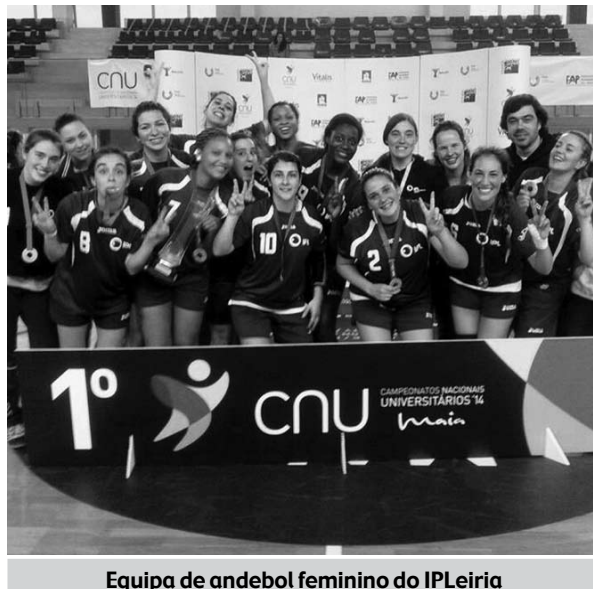
Equipa de andebol feminino do IPLeiria

A equipa de andebol feminino do Instituto Politécnico de Leiria (IPLeiria) venceu o Campeonato Nacional Universitário (CNU) da modalidade, depois de três dias da