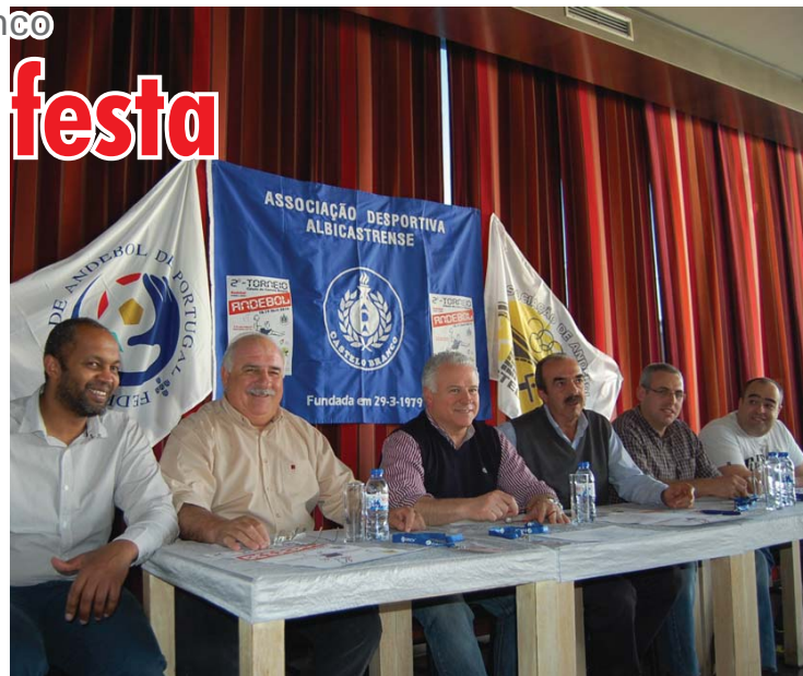
Dirigentes apresentaram o torneio para bambis e minis

O II Torneio de Andebol Cidade de Castelo Branco, em que participam as equipas da ADA, da Casa do Benfica de Castelo Branco, Casa do Benfica do Entroncamento, Assomada A e B, ACD Monte, CA Galinheiras, Q