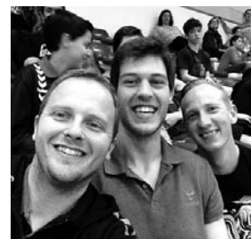
Padrinhos do Torneio