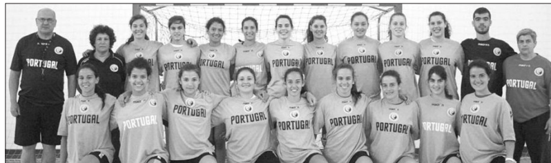
Selecção de Portugal ainda não averbou nenhum triunfo no Mundial.