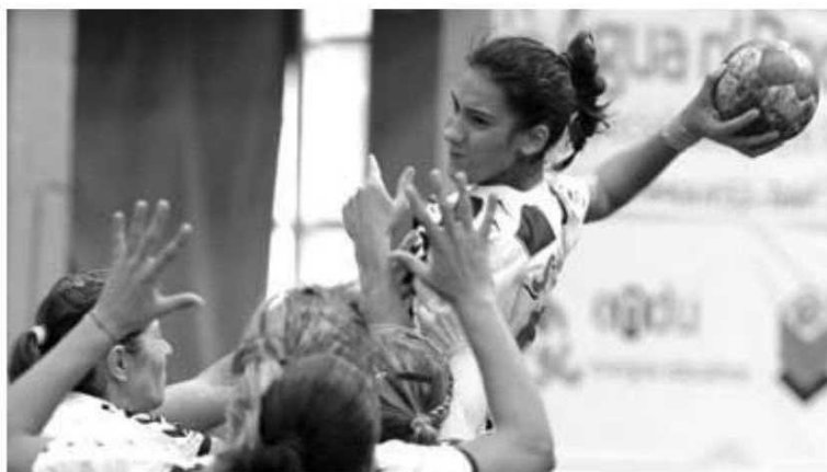
Seleccção nacional volta a jogar hoje, frente à Noruega, às 17h15.

Hoje, Portugal volta a jogar frente à Noruega, selecção que venceu os dois adversários que derrotaram as lusas. O encontro tem início às 17h15.