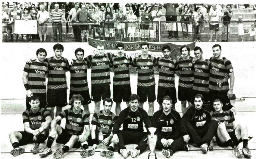
É NOSSA. Jogadores do Sporting mostram aos sócios primeiro troféu conquistado na temporada

Em discussão estava mais uma edição do Troféu Francisco Stromp, que acabou por ser conquistado pela equipa anfitriã, ao vencer por