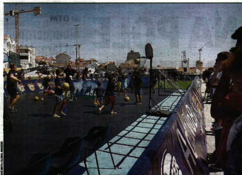
Promoção > A Dragon Force mostrou-se aos veraneantes de Leça da Palmeira