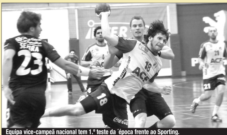
Equipa vice-campeã nacional tem 1.º teste da época frente ao Sporting.

A Supertaça sénior masculina marca o início oficial da época de Andebol (2012/2013), cuja competição está marcada para o final do corrente mês de Agosto, em Fafe. Assim, no dia 31, as meias-finais, no Multiusos de Fafe, envolverá os quatro "grandes" do Andebol luso, no caso as equipas do FC Porto, Madeira SAD, Sporting e Benfica. Ditou o sorteio que na "meias" se defrontem Sporting CP-Madeira Andebol SAD (18h) e SL Benfica-FC Porto (20h). Dois dias depois, a 2 de Setembro, os clubes vencedores vão decidir o 3.º e 4.º lugares, a partir das 14h30, e a final terá início pelas 17h00. Recorde-se que o FC Porto é tetracampeão nacional, o Madeira SAD foi "vice", pelo 2.º ano consecutivo, com as duas formações de Lisboa a se quedarem pelo 3.º e 5.º lugares. Todos os clubes envolvidos vão, ainda, representar o País nas competições europeias.