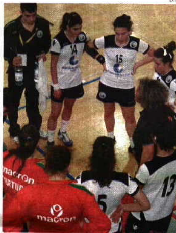
Europeu arranca no dia 23 de Junho

tenegro (31-29), perdendo com a Rússia (23-34) para conseguir o segundo lugar. Esta qualificação, inédita no escalão, vem comprovar a valia desta geração, que já conquistou os Campeonatos do Mediterrâneo e os Jogos dos CPLP no ano passado.