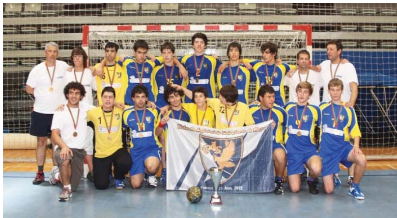
Equipa de andebol vai disputar a primeira categoria nacional na próxima época.