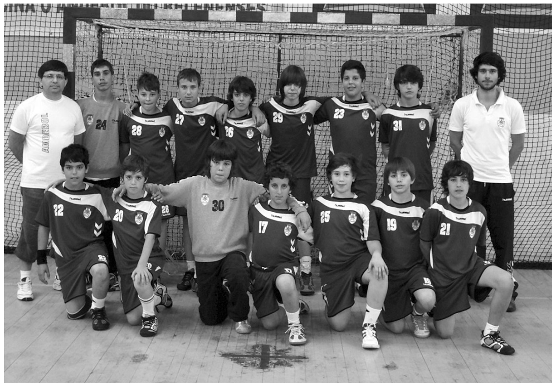
Equipa de Infantis do Feirense presente na 3.ª fase nacional