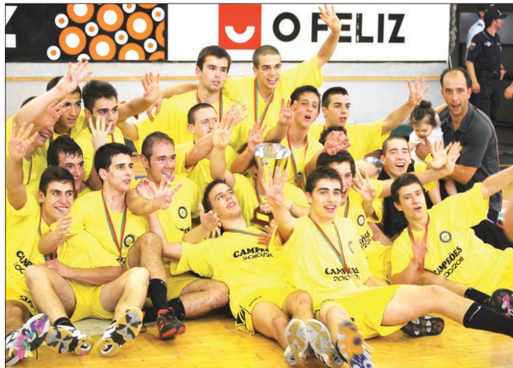
Juvenis e iniciados do ABC de Braga com os respectivos troféus de campeões nacionais