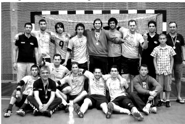
A equipa do ABC de Nelas que arrecadou a Taça 'Associação de Viseu'

Ao derrotar a equipa do Académico de Viseu, a equipa sénior masculina de andebol do ABC de Nelas conquistou a 2ª edição da 'Taça de Andebol da Associação de Andebol' terminado, assim, da melhor maneira a boa época que realizou.