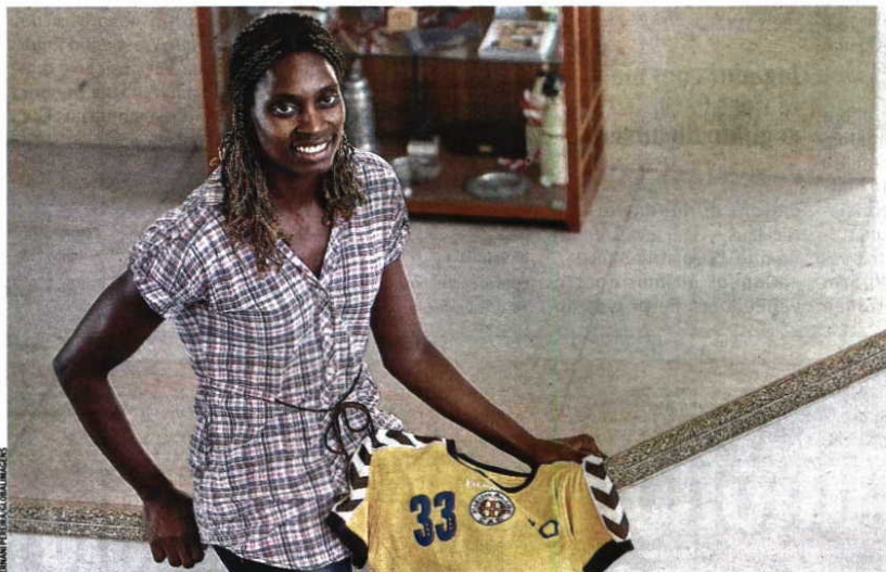
Marcas O sorriso e a camisola com que terminou a carreira, conquistando a Taça de Portugal

Agora que o andebol terminou, vai dedicar-se à enfermagem. “É algo que tem que ver comigo, gosto muito de ajudar as pessoas”, explica.