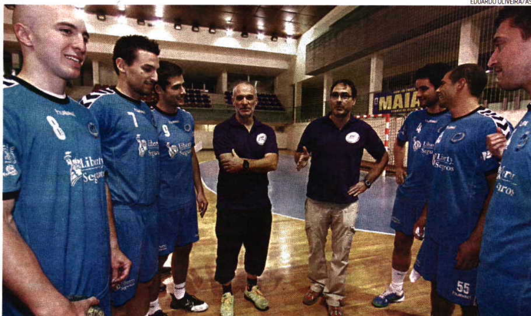
Embora amadora, equipa do ISMAI quer dar uma imagem de solidez e os seus jogadores prometem trabalhar como profissionais