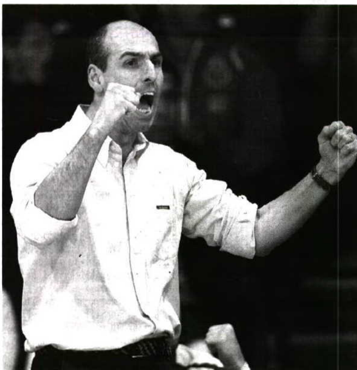
ÍDOLO. Senhor Andebol deixou saudades por onde passou