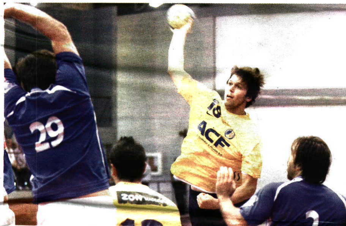
Depois da vitória frente ao Belenenses, o Madeira SAD quer voltar a vencer em casa.

HERBERTO DUARTE PEREIRA desporto@dnnoticias.pt