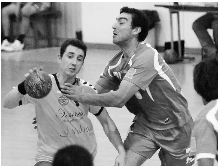
SISMARIA soma segunda vitória consecutiva. Na próxima jornada tem hipóteses de somar mais três pontos

Com este resultado, a Sismaria sobe ao quinto lugar, com 12 pontos, a somente três pontos da equipa do CDE Camões, que ocupa o segundo lugar, o último que permite passar à pró-