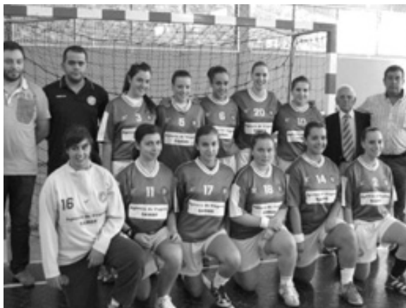
A equipa de juniores femininas do Andebol Clube de Lamego que participa na fase regional de acesso ao campeonato nacional

Foi digna a postura, vontade e a atitude demonstrada, principalmente na segunda parte do desafio, onde foi notória a recuperação no mar-