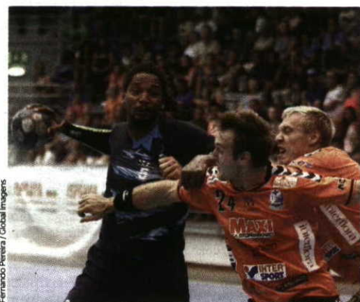
Fernando Pereira / Global Images

e ficámos em 13º lugar. Contudo, jamais me esquecerei por ter coincidido com o fim da minha carreira; lesionei-me e não representei mais a seleção sueca", recorda Lindgren, que partilhou outras experiências nas suas passagens pelo Norte do país, em especial pela Invicta: "O Porto é uma cidade bonita e as pessoas são muito simpáticas. Ainda me lembro do vinho do Porto, aliás tenho algumas garrafas da altura em que vim jogar."