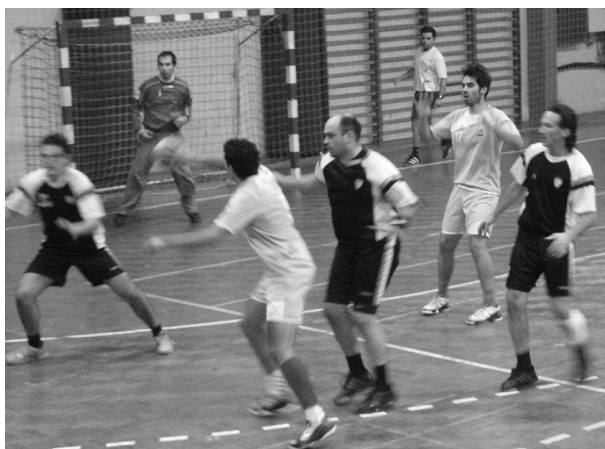
O Académico fez a pior exibição da época frente ao Tondela (arquivo)