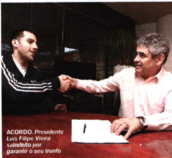
ACORDO. Presidente Luís Filipe Vieira satisfeito por garantir o seu trunfo

O central revelou ainda que o clube da Luz desempenhou um papel muito importante no seu desenvolvi-