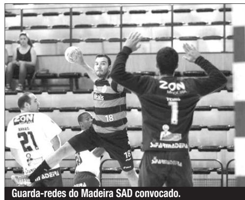
Guarda-redes do Madeira SAD convocado.