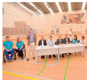
Travessia em espírito solidário