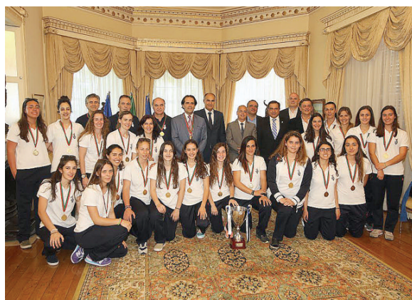
As meninas do CS Madeira, vencedoras da Taça de Portugal.