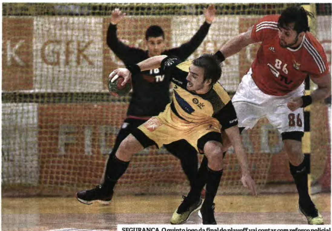
SEGURANÇA. O quinto jogo da final do playoff vai contar com reforço policial

sos ao Benfica, sob pena de o decisivo encontro ser disputado em São João da Madeira. Os bracaraenses acabaram por ceder e têm de organizar um jogo de risco elevado.