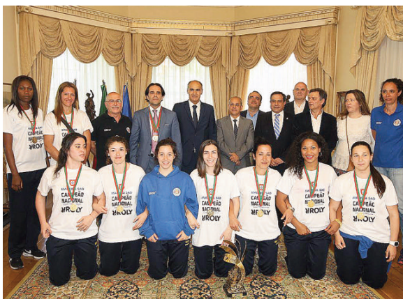
Plantel campeã do Madeira SAD recebido na Quinta Vigia

Portanto, parece certo que a equipa do Madeira SAD fica fora da Liga dos Campeões. JM