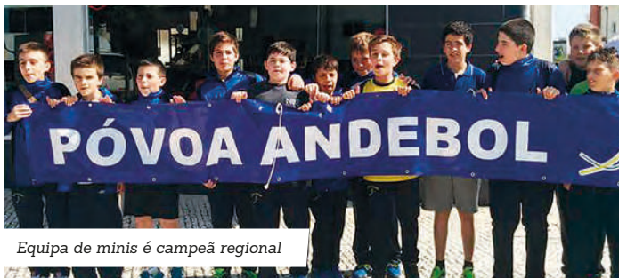
Equipa de minis é campeã regional

Depois de vencer o Azurara por 16-12, no passado fim de semana, a equipa de minis do Póvoa Andebol sagrou-se campeã regional.