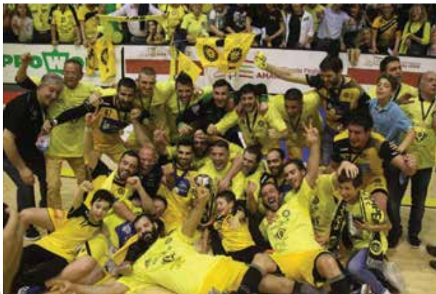
Equipa do ABC de Braga

“Voltamos a trazer os adeptos do andebol ao pavilhão num clube onde fazemos vendeiros milagres. O plantel é todo português e temos três atletas com 17 anos no plantel. É com esta gente e com a formação do