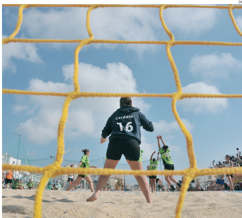
Prova realiza-se de 8 a 10 de Julho na praia da Nazaré