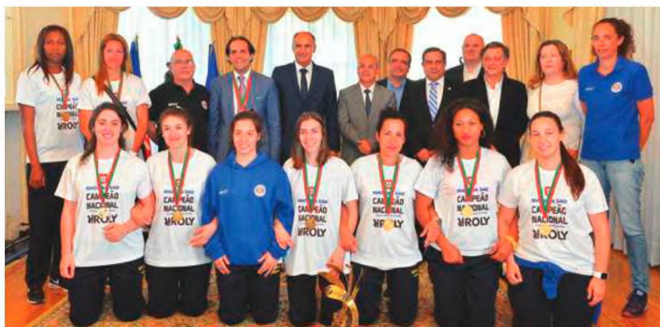
As campeãs nacionais foram à Quinta Vigia mostrar a taça.