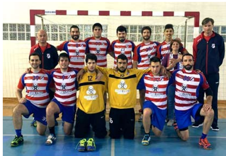
SPORTING DA HORTA "B" confirmou favoritismo em prova equilibrada

Classificação final (todas as equipas com quatro jogos): 1.º Sporting da Horta "B" 10 pontos (+2 em golos), 2.º Marítimo SC 10 (saldo nulo em golos), 3.º GD São Pedro 10 (-2 em golos), 4.º GD Biscoitos 6, 5.º GDGP Arrifes 4. di