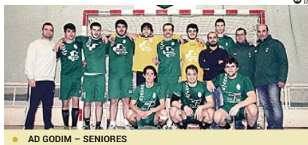
● AD GODIM – SENIORES

Torneio Encerramento Iniciados Masculinos: Domingo, às 15h00 – Pavilhão Terras de Vermoim: Ac Vermoim - Ad Godim