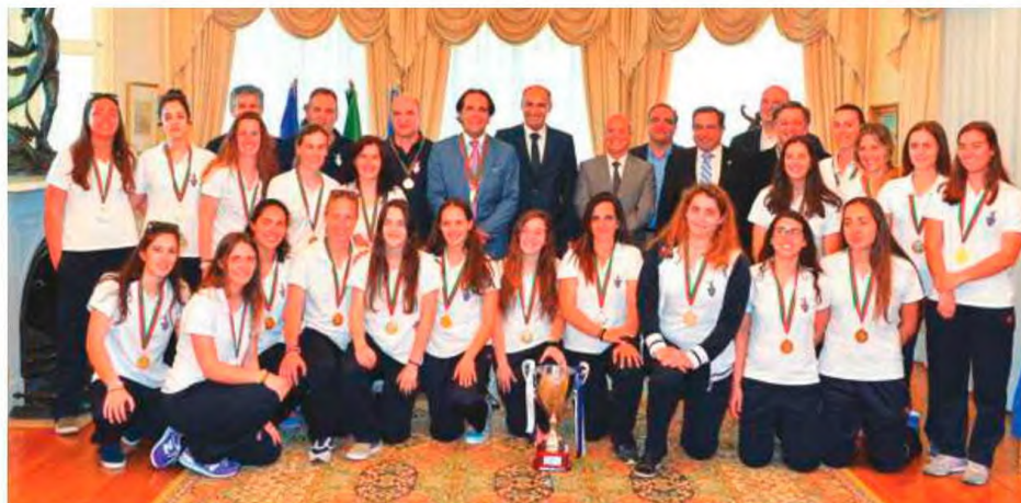
A equipa vencedora da Taça de Portugal não faltou à homenagem.

Refira-se que sem mais apoio empresarial e da Região, o Madeira SAD poderá falhar a pré-inscrição da 'Champions League' feminina de andebol, por não ter 15 mil euros e um pavilhão com capacidade mínima para 2.000 espectadores sentados. Mesmo assim, a candidatura avançou e clube, em alternativa, poderá participar na EHF Cup, a II Divisão das competições europeias.