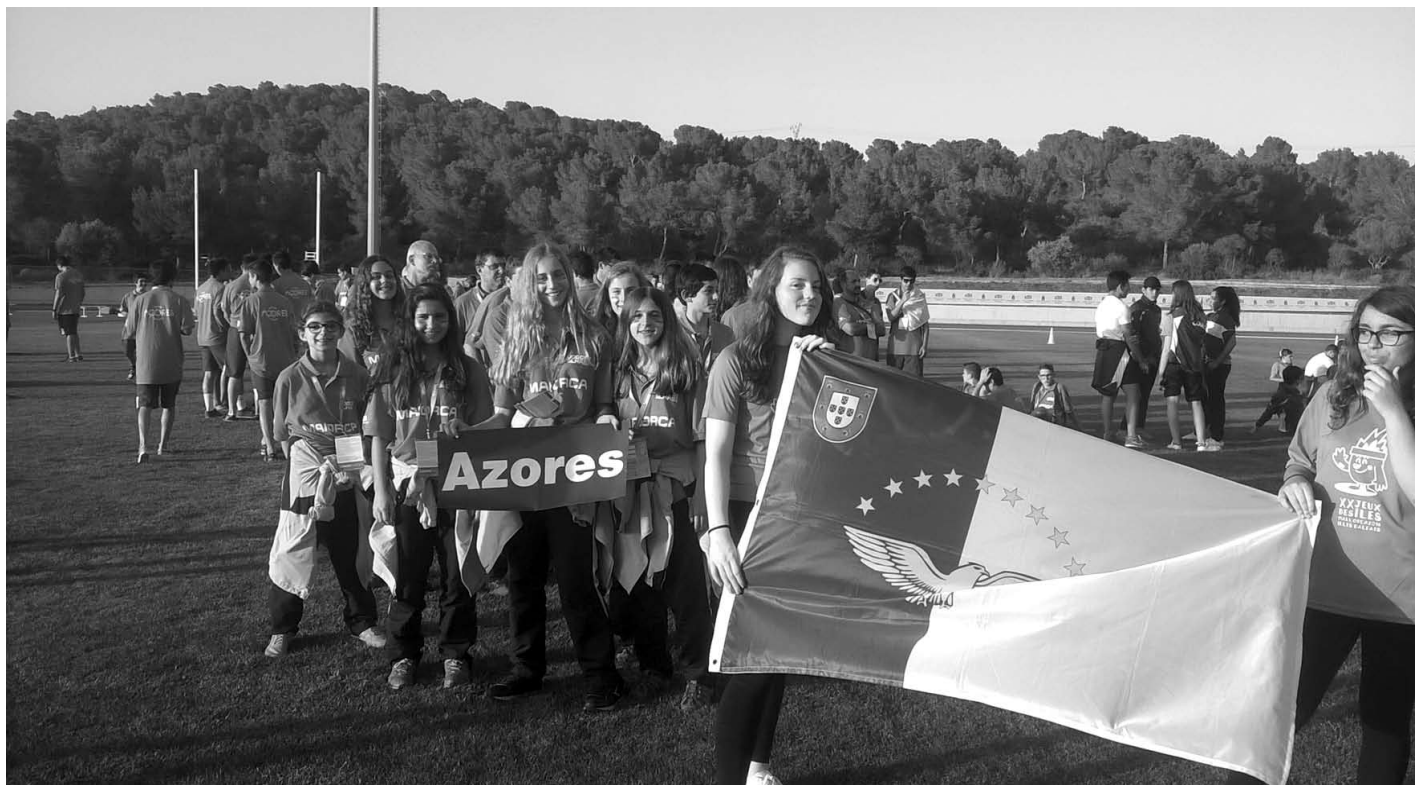
AZORES fazem parte do projeto Jogos Desportivos das Ilhas desde a primeira hora

A promoção do desporto no seio da juventude insular europeia e do espírito olímpico é objetivo dos Jogos Desportivos das Ilhas.