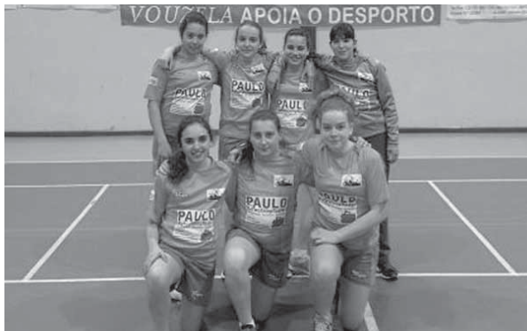
As atletas femininas, com idades entre os 11 e 13 anos, asseguraram este lugar, após terem sido vice-campeãs no Campeonato Regional de Viseu