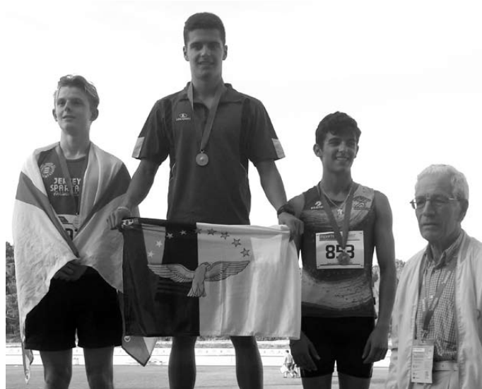
JOGOS DAS ILHAS têm como pano de fundo o ideal olímpico Página 19

Quanto à classificação geral dos XX Jogos das Ilhas sucesso para a Si-