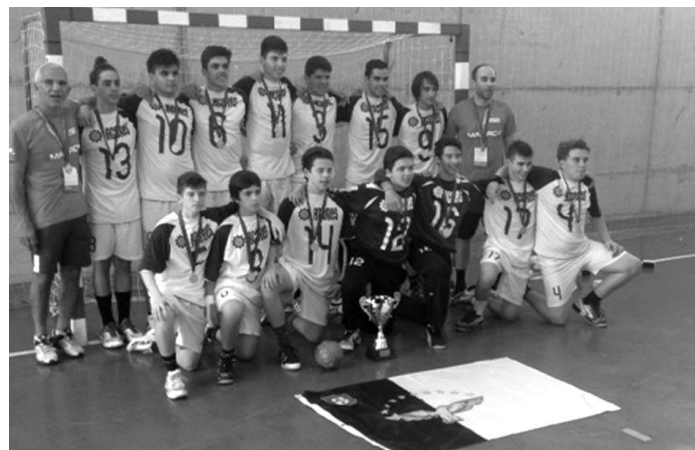
ANDEBOL açoriano alcançou primeiro lugar em Maiorca

O quadro de modalidades oficiais é o seguinte: andebol, atletismo, basquetebol, futebol, ginástica, judo, natação, rãguebi, ténis, ténis de mesa, vela e voleibol. ■