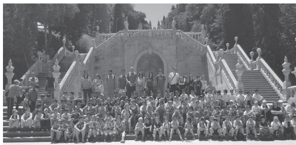
Os alunos que participaram nesta iniciativa dos vários municípios do distrito