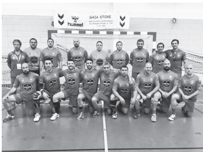
“Verde-rubros” lutaram estoicamente contra um adversário muito forte.

A equipa de veteranos do CS Marítimo sagrou-se vice-campeã nacional, no passado domingo, após perder por 29-25 ante o Masters Andebol Porto, em jogo disputado em Macieira da Maia, Vila do Conde. A partida foi bem disputada e equilibrada, pelo menos até a equipa de arbitragem “estragar” o jogo com intervenções que prejudicaram o conjunto madeirense. Contudo, a final propiciou um excelente jogo de andebol entre os dois grandes candidatos ao título nacional. O Marítimo foi para o intervalo a perder por 12-11. No reatamento, o conjunto “verde-rubro” entrou disposto a dar a volta ao resultado, mas “esbarrou” numa arbitragem “casei-