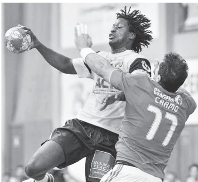
Madeira SAD recebe lateral esquerdo oriundo do Futebol Clube do Porto

No Madeira SAD, foi vice-campeão nacional em 2011/2012. Na época seguinte, em que se mudou para a cidade invicta, sagrou-se campeão nacional, constituindo o seu primeiro troféu