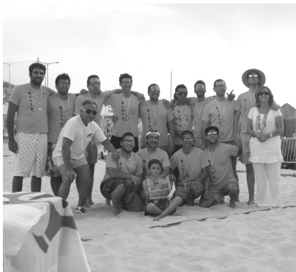
DICIS TEAM da Nazaré venceu o escalão de masters masculinos

Na final, a jovem equipa da Marinha Grande não conseguiu repetir a surpresa e foi derrotada pela equipa Lois/Autoliz, equipa que justificou o favoritismo, pois é constituída por atletas do Colégio João de Barros.