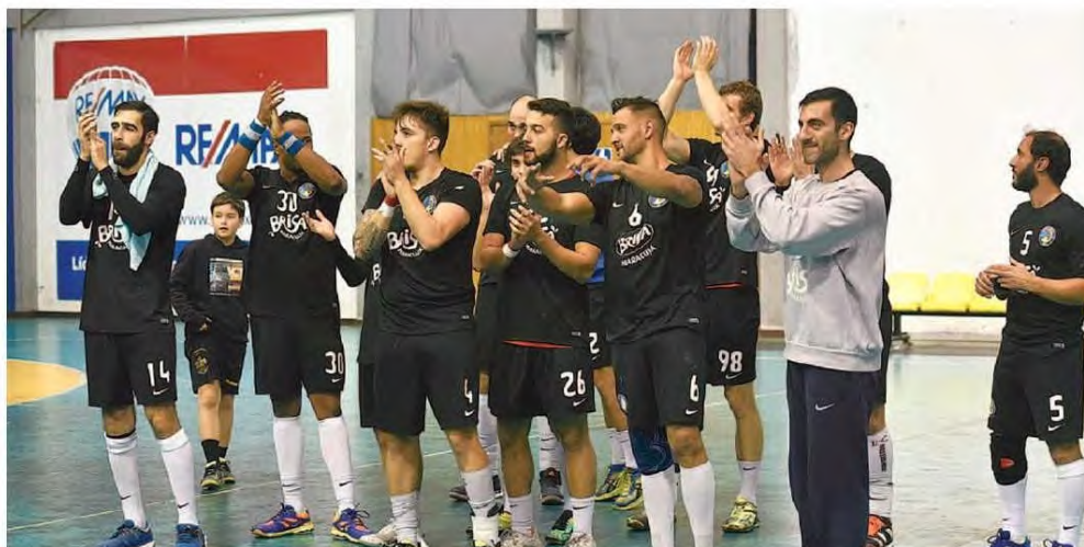
Madeira SAD bateu o ABC, por 24-23, num grande espectáculo de andebol.