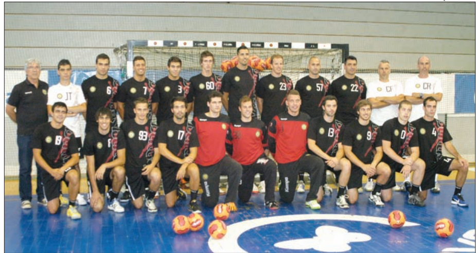
ABC participa, em Fafe, no Torneio de Andebol de Portugal

Para além dos pavilhões expositores dos diversos clubes filiados na Associação de Andebol de Braga que aderiram