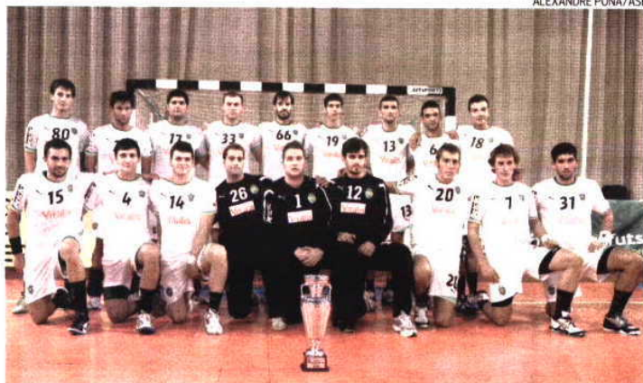
Sporting, que após o intervalo se equipou de branco, já na posse do Troféu Francisco Stropm