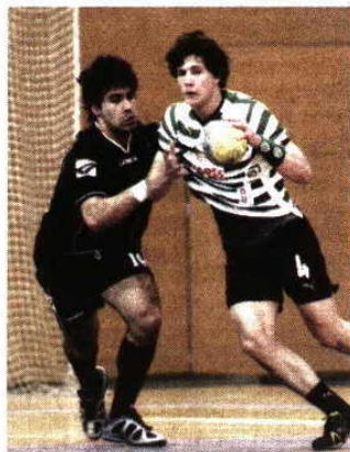
Realizou excelente época com os leões

conheço que era um sonho de menino jogar no Sporting. A temporada passada vencemos a Taça Challenge e foi um troféu muito importante para o grupo, para mim e para o país. É indescritível conquistar uma prova europeia», referiu.