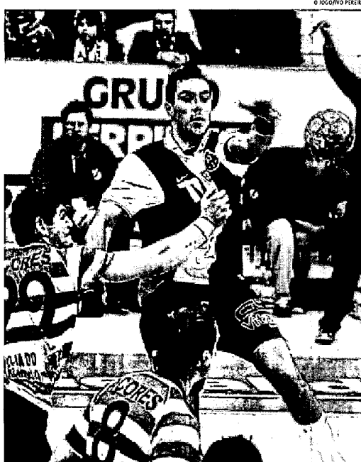
Sporting da Horta vai receber o Belenenses na primeira jornada