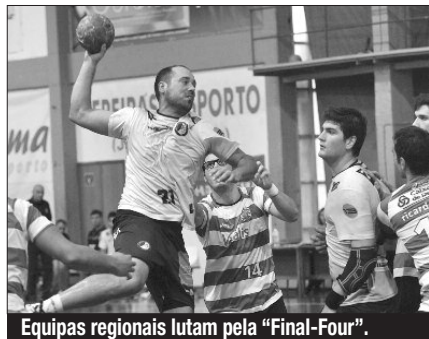
Equipas regionais lutam pela "Final-Four".

O sorteio dos quartos-de-final da Taça de Portugal de Andebol - seniores masculinos decorreu ontem à tarde, nas instalações da Federação, em Lisboa. Num dos jogos de maior destaque desta eliminatória que está agendada par dia 23 do corrente, o ABC de Braga recebe o FC Porto, no Pavilhão Flávio Sá Leite. Na Madeira, o CS Marítimo (2.ª Divisão) joga com o Águas Santas e o Benfica tem uma curta deslocação, dentro da capital, para jogar com o Passos Manuel (2.ª Divisão). Quanto ao Madeira SAD sabe, apenas,