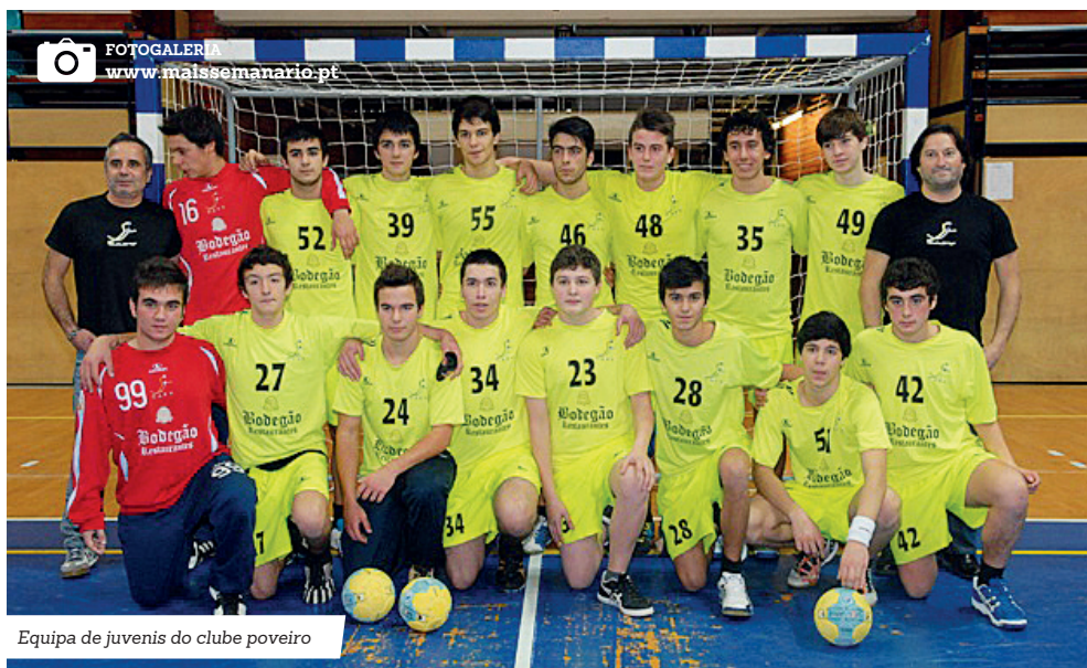
Equipa de juvenis do clube poveiro

Atualmente, o clube conta com quatro escalões: minis (9-10), infantis (11-12), iniciados (13-14) e juvenis (15-17), a competirem no Campeonato Regional do