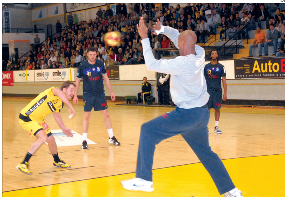
ABC-FC Porto é o “jogo grande” dos quartos de final

Sendo assim, a equipa de Aleksander Donner deverá viajar até Fafe para medir forças com o conjunto local.