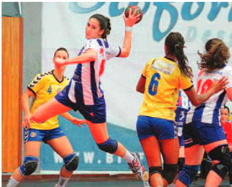
Clube solicitou o adiamento do prazo de inscrição.