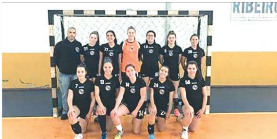
Equipa de iniciadas do CS Juventude de Mar

A equipa de iniciadas em andebol feminino do Centro Social da Juventude de Mar, Esposende, sagrou-se campeã distrital de Braga da categoria, ao receber e derrotar a Didáxis por 31-24.