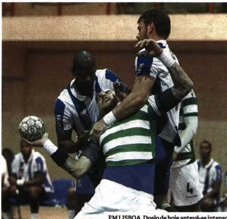
EM LISBOA. Duelo de hoje antevê-se intenso

Sporting recebe hoje o invicto FC Porto ciente que em caso de derrota os dragões entram em fuga