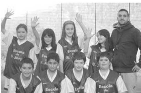
Escola de São Jorge.