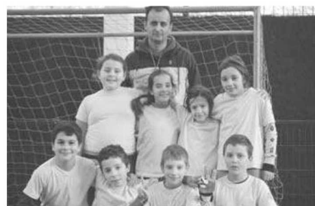
Escola de São Roque do Faial.