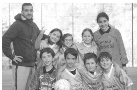
Escola do Caminho do Chão.

Também 4ª feira houve Festival de Natação nas Piscinas da Penteada para a Zona do Funchal (escolas Jaime Moniz, AA Silva e São Roque) e para a Escola da Camacha.