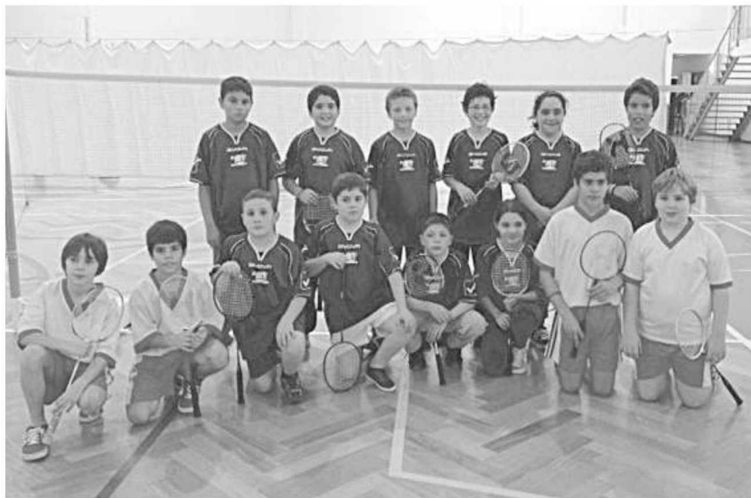
Equipas de badminton das Escolas do Caniçal e do Porto da Cruz.