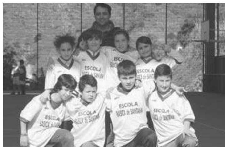
Escola de Santana