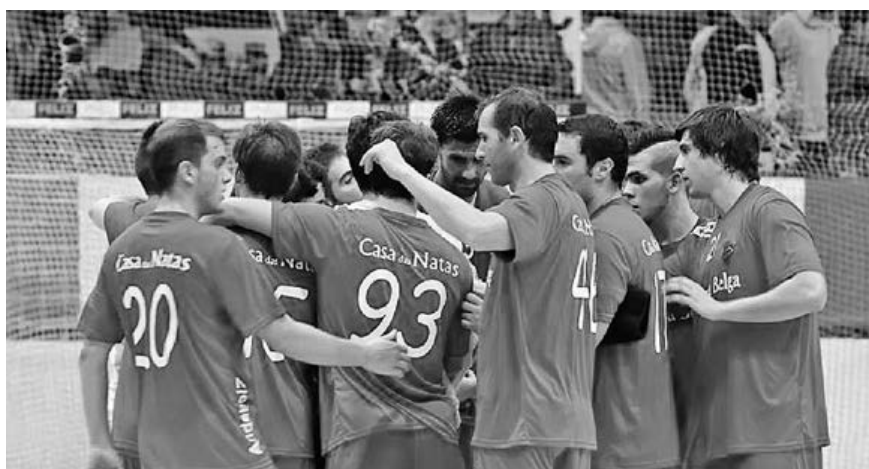
Arsenal da Devesa continua imbatível na primeira fase do Campeonato Nacional de Andebol da III Divisão

A equipa bracarense conquistou o seu 10.º triunfo em dez jogos disputados no campeonato e segue sem qualquer oposição na liderança da prova, tendo confirmado a conquista do primeiro lugar nesta primeira fase. Faltam disputar dois jogos nesta fase e os bracarense querem fazer o pleno de triunfos nesta fase da competição.