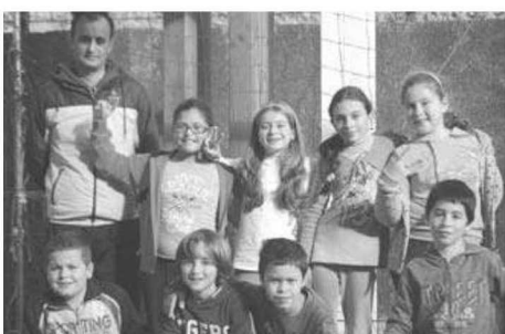
Escola do Faial.