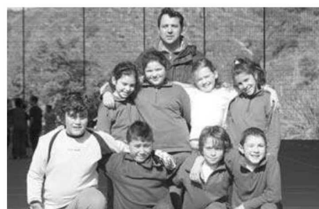
Externato da Sagrada Família.