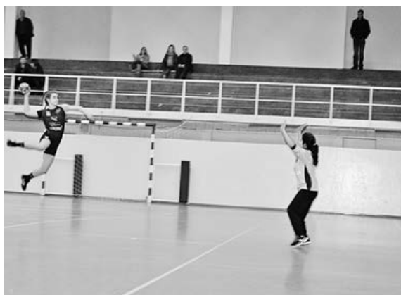
Iniciadas da Didáxis terminaram imbatíveis a primeira fase do campeonato

Já a equipa de juvenis cumpriu a penúltima jornada com a recepção ao vizinho AC Vermoim, tendo registado mais uma vitória esclarecedora por 34-11.