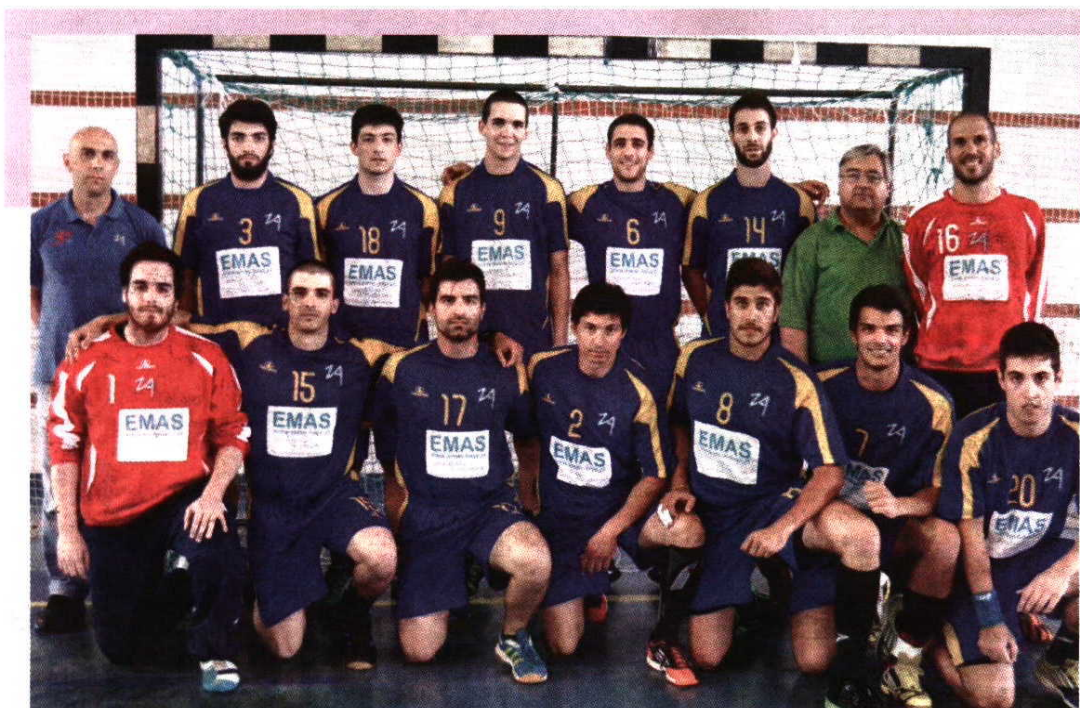
Zona Azul 4.º lugar na fase de promoção do Nacional da 3.ª Divisão de andebol

No rescaldo da grande temporada da equipa de andebol da Zona Azul