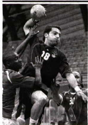
Águias com duro teste pela frente

ANDEBOL ))) EQUIPA DA LUZ RECEBE O BELENENSES NA ÚLTIMA JORNADA DA FASE REGULAR