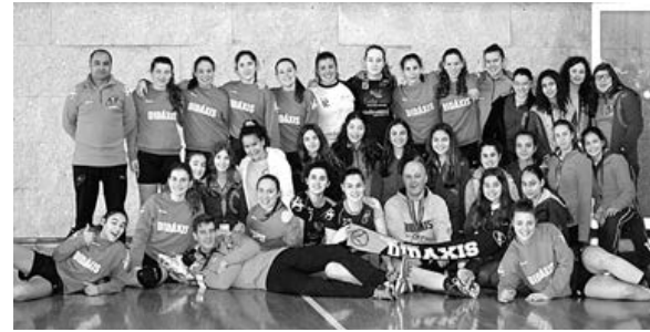
Infantis e juvenis da Associação Académica Didáxis

Depois de ter vencido todos os jogos da fase regular, a Didáxis acabou por derrotar o Cale na final, por 29-22, perante um pavilhão cheio de apoiantes das duas equipas. Para além do primeiro lugar no torneio, as juvenis da Didáxis também foram distinguidas com os prémios de melhor ataque e melhor defesa da competição.