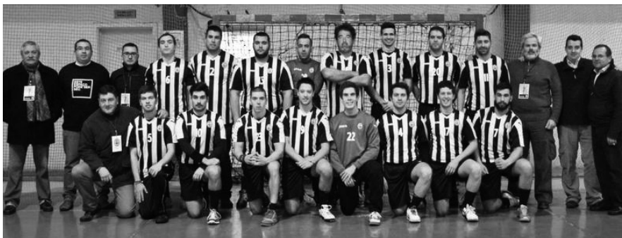
Equipa do Beira-Mar Andebol

Terei a veleidade de dizer que como nenhum outro. Para os atletas serem reconhecidos na rua e abordados por adeptos acerca dos jogos; terem uma claqué que dá um ambiente nunca antes sentido num jogo de andebol da nossa região. Em cada jogo em casa entrar ao som do hino do Clube