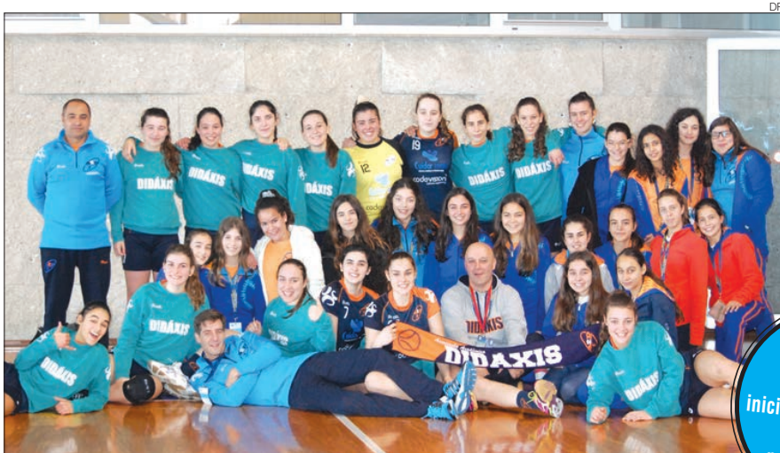
Juvenis e infantis da Didáxis

A Associação Académica Didáxis participou com as suas equipas de juvenis e infantis no Torneio Handleça Cup 2015, disputado no passado fim de sema-