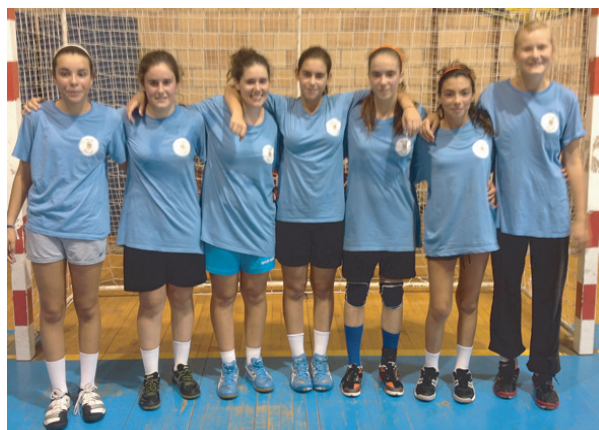
As atletas que integraram o estágio da Selecção Regional de Viseu

Com as expectativas em alta, as atletas do escalão de Juvenis também se apresentaram no passado sábado e não deixaram de se mostrar em grande. Afinal, com o campeonato a começar, atletas e dirigentes mostram-se ansiosos por dar o seu melhor e passar à segunda fase,