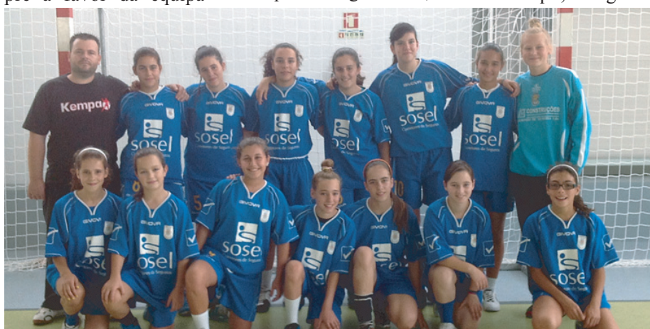
A equipa de Iniciadas que se apresentou no passado sábado

Mas as boas novas não terminam por aqui, já que algumas atletas do ACOF foram chamadas ao treino da Selecção Regional de Viseu, que decorreu em São Pedro do Sul, no passado domingo, dia 23. “O estágio correu bem e todas as atletas saíram satisfeitas por terem a oportunidade de fazer parte das eleitas da Associação de Andebol de Viseu. Foi uma oportunidade de demonstrar o bom trabalho que se vai fazendo em nosso Clube”, destacou o treinador.