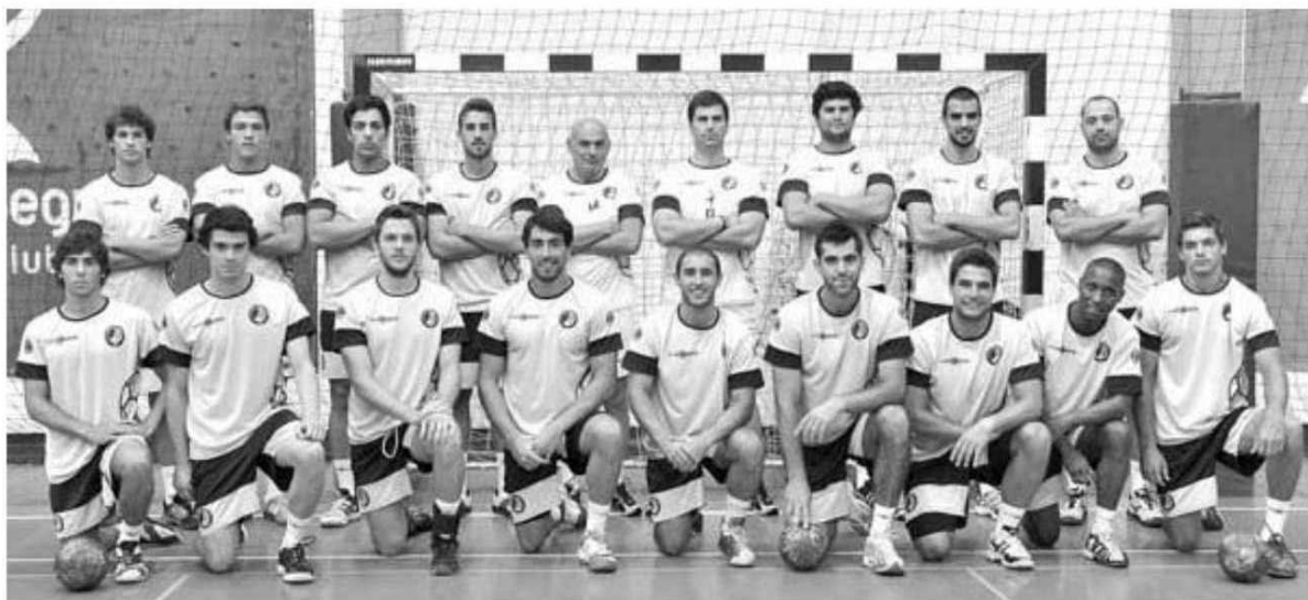
A equipa do Madeira SAD tem a manutenção (quase) garantida.