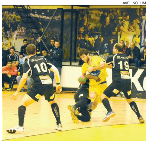
Lutou-se muito no Flávio Sá Leite

«Foi um jogo extremamente difícil contra uma boa equipa. Luta interessante, foi o primeiro confronto dos vários que iremos ter, e diria que foi uma excelente entrada para brindar o nosso público. Bom andebol, de qualidade. Quero dizer duas coisas importantes após esta boa vitória: em primeiro lugar, em meu nome pessoal e como treinador da equipa sénior, o meu muito obrigado à equipa júnior porque estamos convencidos que se não tivéssemos a ajuda deles na última quarta-feira com o Sporting da Horta este resultado não teria sido possível. Segundo, uma palavra de apreço ao Águas Santas pela excelente luta que deu e dizer-lhes que se jogarem assim contra todos os adversários têm equipa para lutar pelo título», destacou o treinador da turma academista, salientando que o sucesso esteve, sobretudo, na melhoria do rendimento defensivo na segunda parte (12 golos sofridos contra 18 na primeira parte).