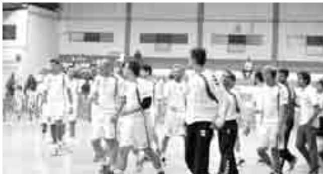
Vitória de Setúbal surpreendeu Ginásio do Sul no pavilhão da Cova da Piedade