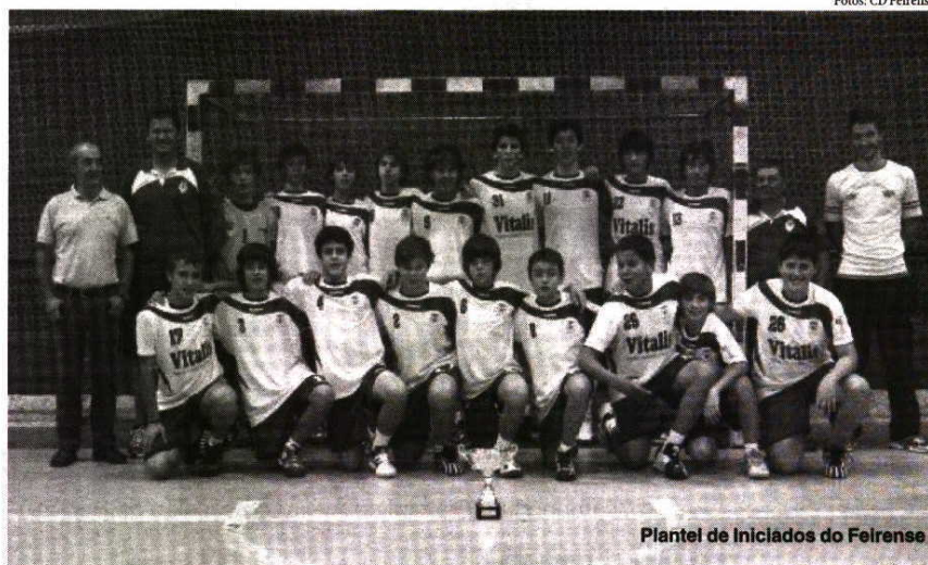
Plantel de Iniciados do Feirense