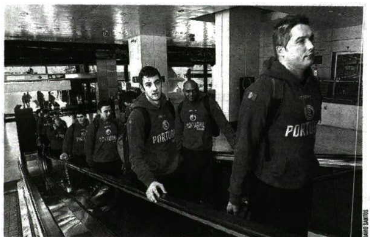
ANDEBOL. A Seleção Nacional partiu ontem para Mersin, onde amanhã defronta a Turquia, em jogo de qualificação para o Mundial