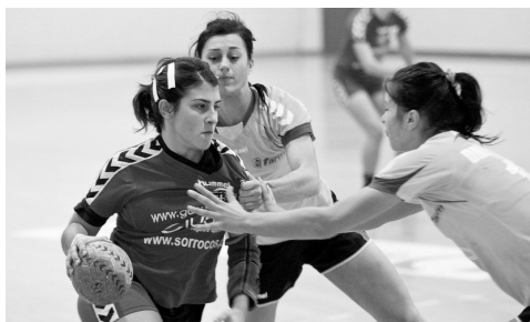
JUVE LIS venceu a eliminatória pela diferença de um golo

foram as melhores marcadoras da Juve Lis, com cinco golos