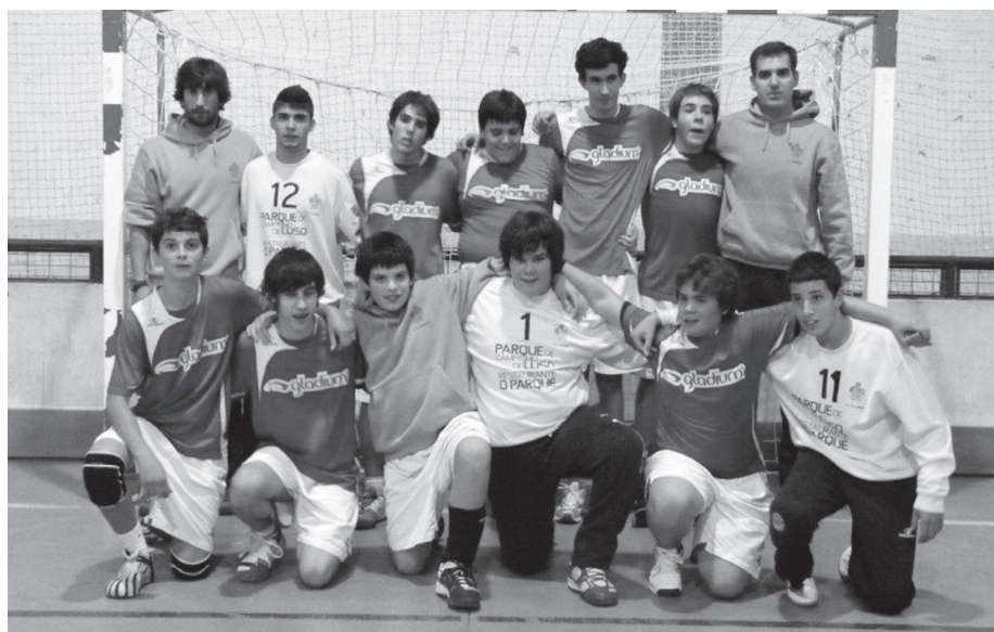
Equipa de Juvenis da Casa do Povo da Vacariça

Nestas últimas jornadas têm sido bastante complicado triunfar para os Bairradinos, uma derrota frente ao CAIC e somaram este domingo