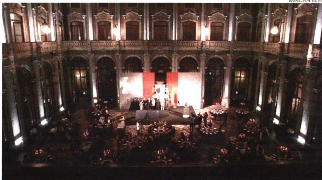
Festa do centenário do Académico mostrou a vitalidade de um clube pronto para pelo menos mais um século de história

O Académico era e é tudo o que o rodeia e seduziu, estou certo, quase toda a gente que por ali passou. O respeito de valores tão fora de moda e a constante lição de vida e humanidade podem não ter construído grandes campeões desportivos mas formaram homens de inestimável mérito social e, sobretudo, adeptos e dirigentes de primeira classe, pormenor nada desprezível nos tempos que correm. É esse Académico de gente simples mas solidária, dessa autêntica e afectuosa família, que guardarei na memória. O prestígio, como diz o outro, será sempre difícil de atingir, mas fica bem melhor nos registos da história do que o efêmero sucesso de uma qualquer equipa. O Académico, se não foi visto ainda por lá, deve estar a chegar!