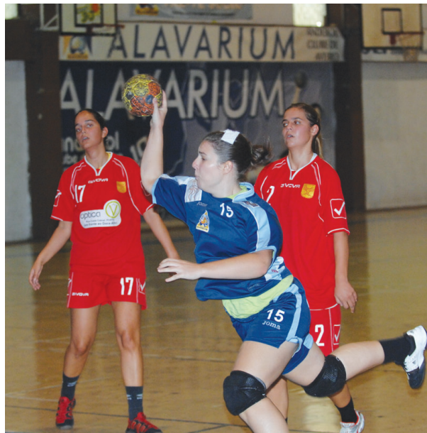
AS JOGADORAS do Alavarium estão prestes a fazer história

O único lamento que se sente na “família Alavarium” reside no facto da prova não se realizar no seu pró-