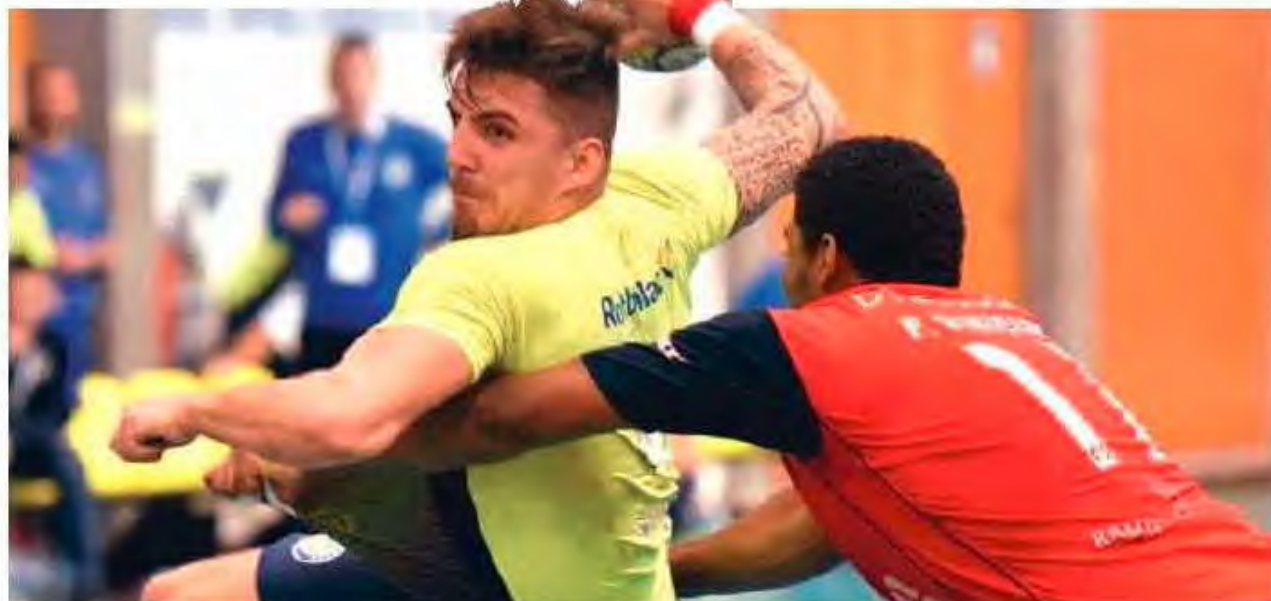
Madeirenses jogam esta noite no Pavilhão do Funchal.