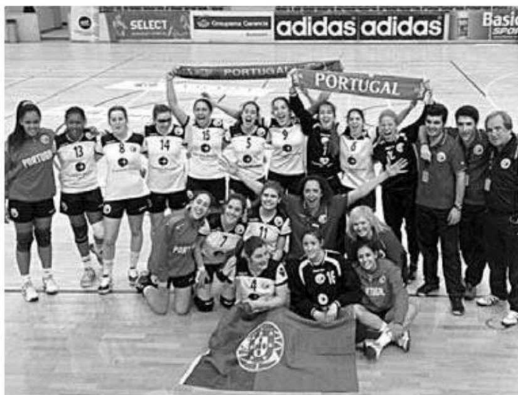
Portugal soma desaire na estreia diante da Polónia.