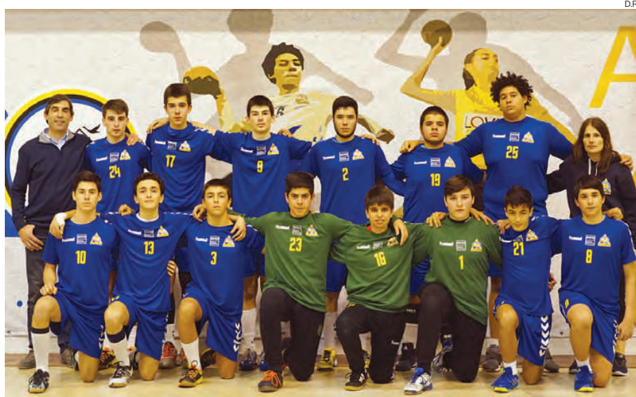
A equipa de Iniciados Masculinos do Alavarium - Andebol Clube de Aveiro

A jovem formação do Alavarium, que hoje recebe a equipa do S. Paio de Oleiros na penúltima jornada, ganhou assim o direito de representar Aveiro na fase nacional do campeonato do escalão, que se inicia