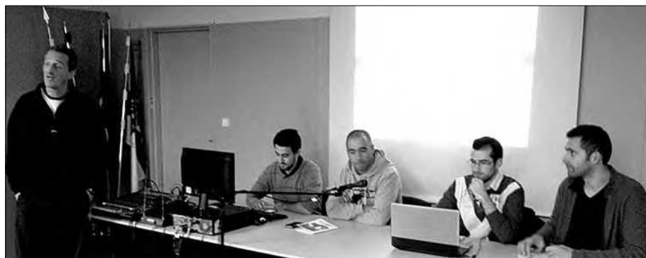
Um pormenor da ação de formação

O objetivo da formação foi promover uma melhor consciência face às principais regras do jogo, técnica de arbitragem e, ainda, preparar os jovens interessados para a formação de Desporto Escolar de nível 2 no dia 30 de ja-