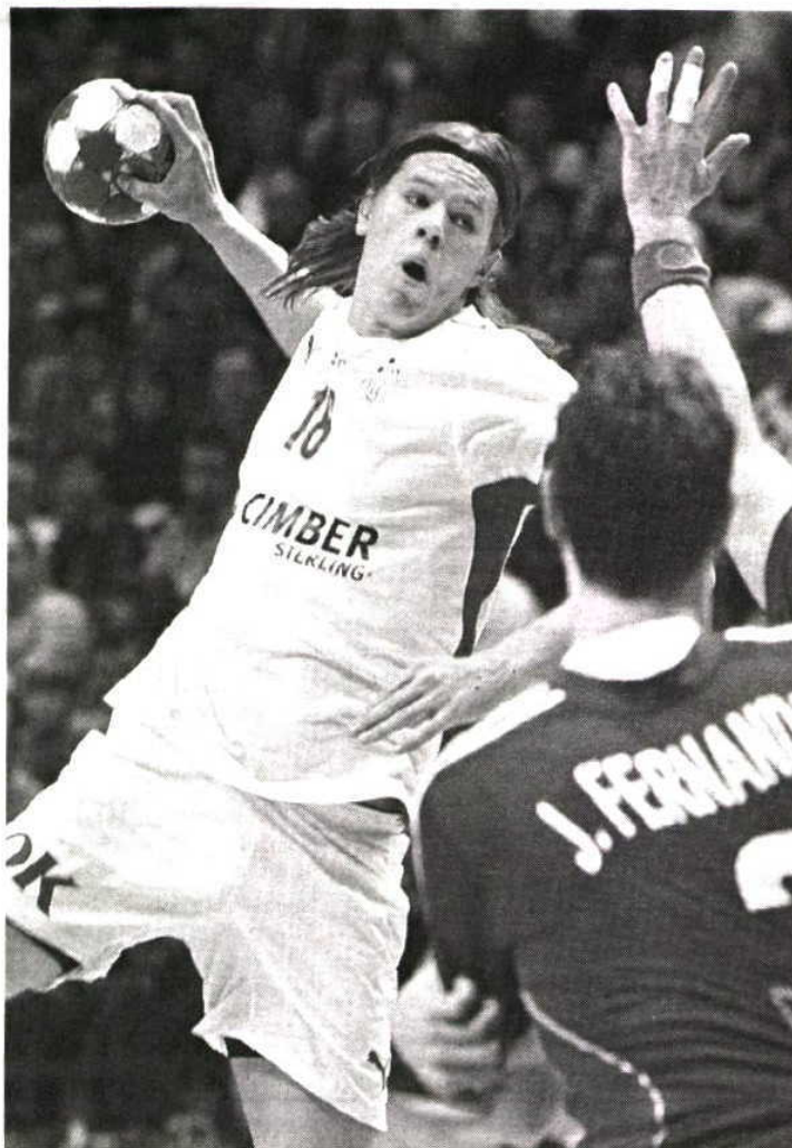
DUELO. Ataque da Dinamarca vai afrontar uma defesa intratável