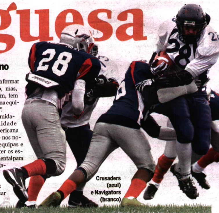
Crusaders (azul) e Navigators (branco)

A proximidade à realidade norte-americana é evidente nos nomes das equipas e tácticas de jogo. Manter os estrangeirismos é fundamental para alguns treinadores e jogadores americanos, muitos deles funcionários de embaixadas que não querem abdicar desta paixão. ■