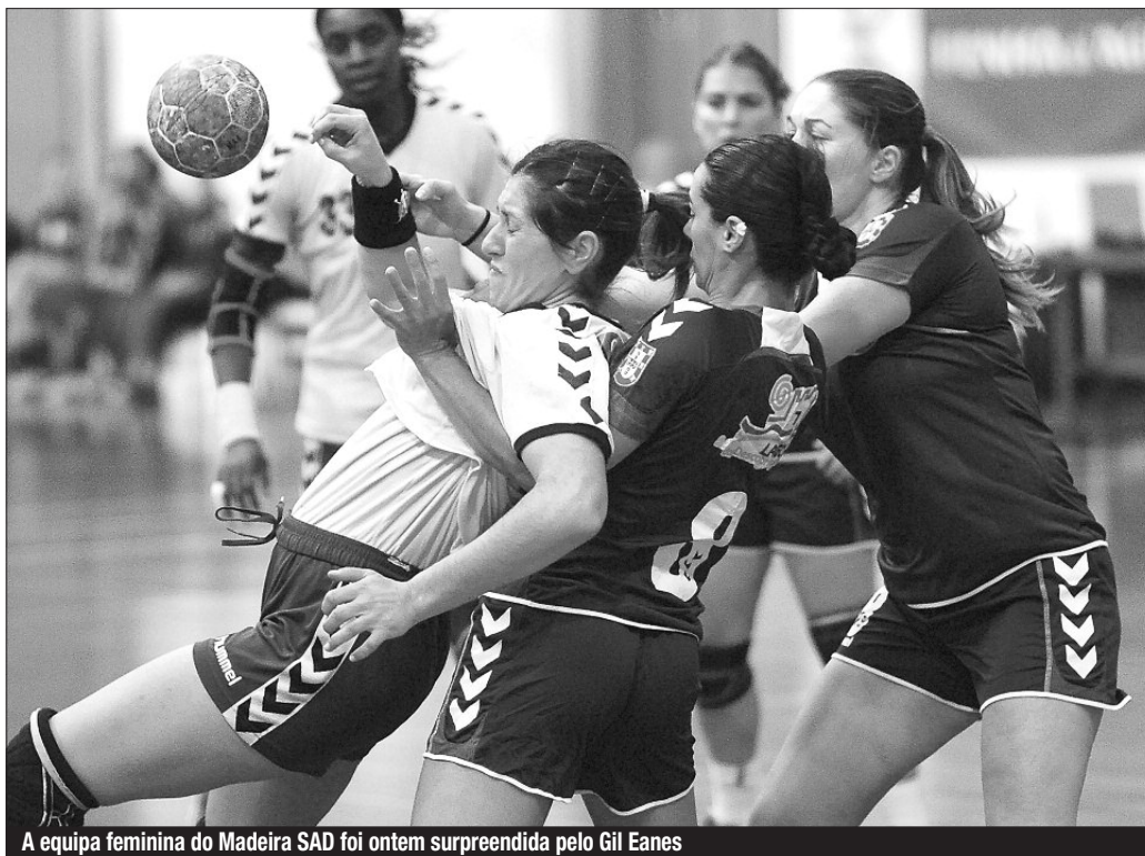
A equipa feminina do Madeira SAD foi ontem surpreendida pelo Gil Eanes