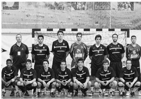
Juniores masculinos da Artísita de Avanca