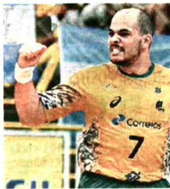
Internacional tem 20 anos

O jogador chega do EC Pinheiros, clube de São Paulo, e encontra-se na concentração da seleção brasileira que prepara a participação no Campeonato do Mundo de