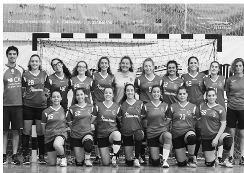
Juvenis femininos do Valongo do Vouga