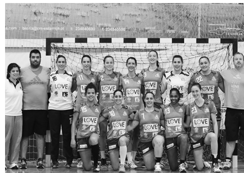
Seniores femininos do Alavarium