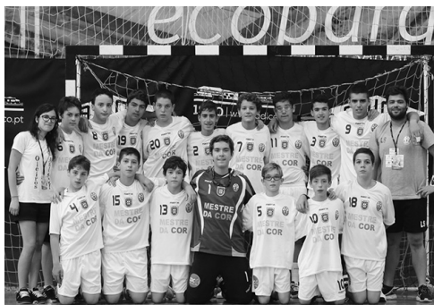
Infantis masculinos do São Paio de Oleiros