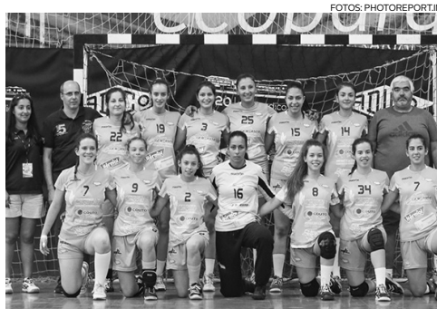
Juniores femininos do Arsenal de Canelas